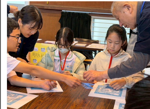
圖 11：本島交流日日本摺紙體驗