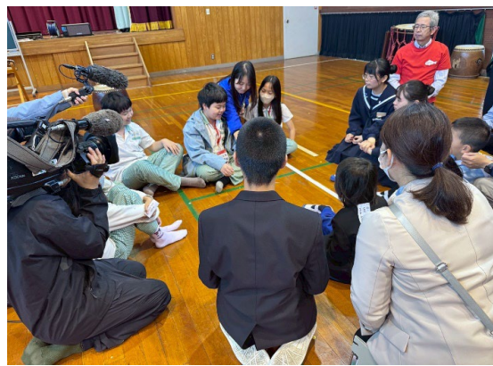
圖 10：本島交流日分組自我介紹