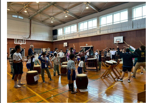
圖 9：本島交流日和太鼓體驗