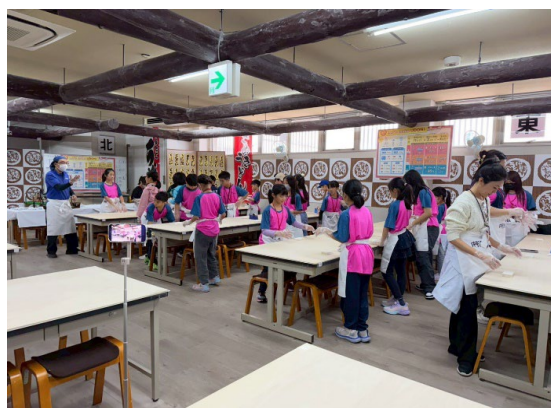
圖 2：讚岐烏龍麵 DIY 體驗