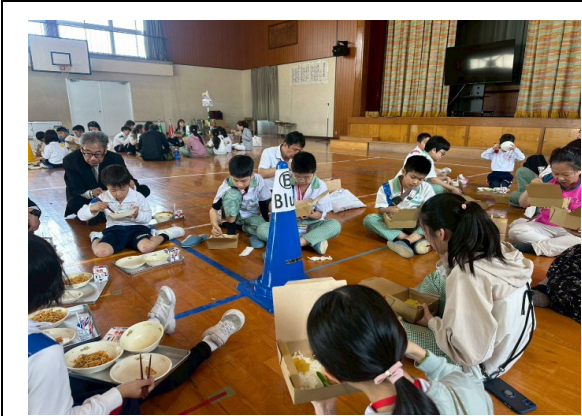
圖 7：與豐島小學師生一起午餐