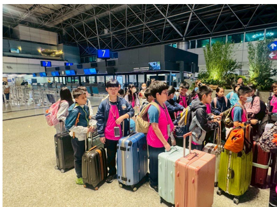
圖 1：在桃園機場準備出發前往日本