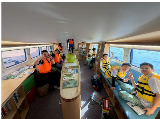
圖 3：搭乘安藤忠雄設計的書之森號