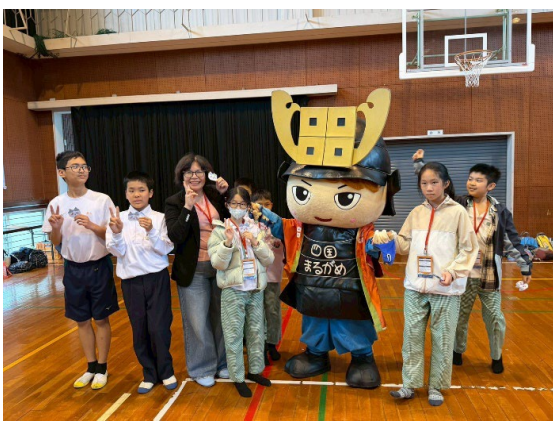
圖 10：與丸龜市吉祥物合影