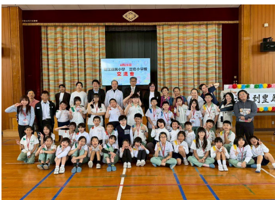
圖 5：與豐島小學師生合影