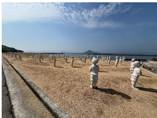
圖 4：林舜龍老師作品<跨越國境 祈>