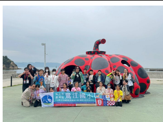
圖 8：直島上探訪草間彌生的紅南瓜