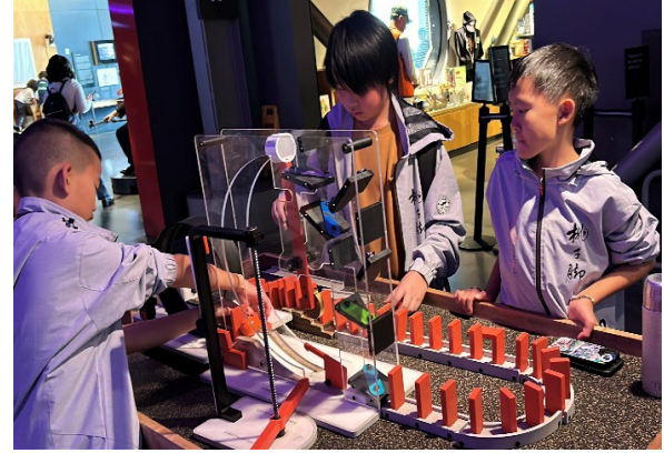
圖14(115/04/04)：加州探索博物館之互動式體驗