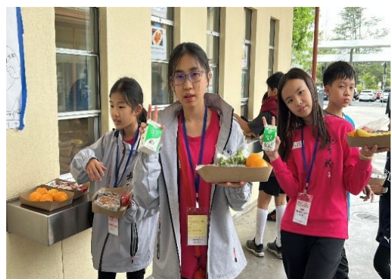
圖5(115/03/31)：Almond 小學午餐時間取餐