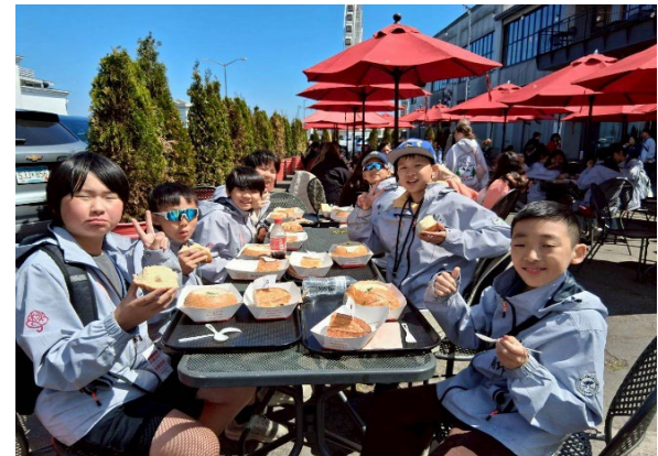
圖18(115/04/06)：品嚐漁人碼頭知名的巧達麵包湯