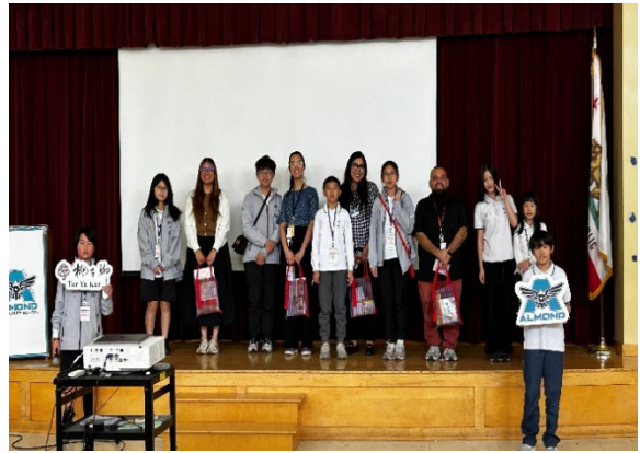
圖8(115/04/01)：感恩會之學生代表致贈 Almond 小學師長桃子腳文創伴手禮