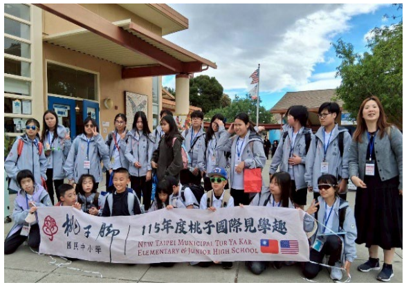
圖10(115/04/01)：Almond 小學入班三天紀念團體照