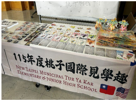
圖9(115/04/01)：設攤展示臺灣意象與桃子腳特製文創品，並致贈給4個入班班級學生。