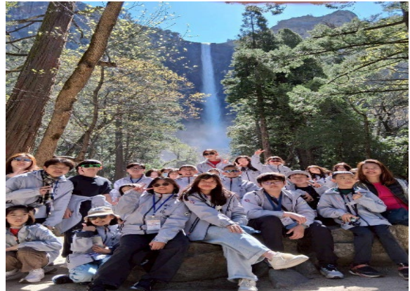
圖12(115/04/03)：參訪優勝美地瀑布及巨岩