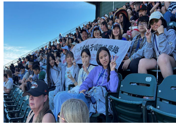
圖16(115/04/05)：觀賞美國職棒 MLB 舊金山巨人與紐約大都會的比賽