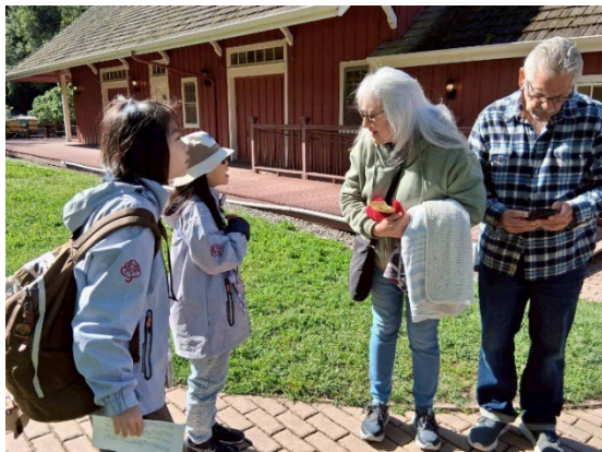
圖11(115/04/02)：學生在紅木森林園區向外國遊客進行街頭訪問