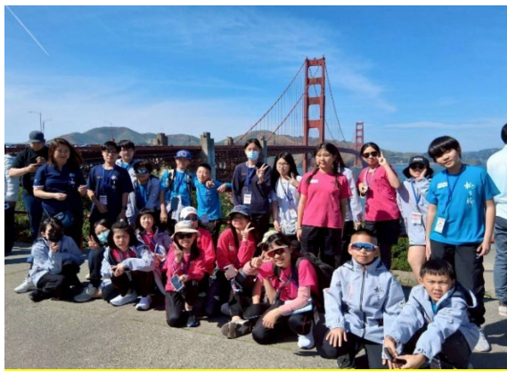
圖3(115/03/29)：舊金山地標-金門大橋