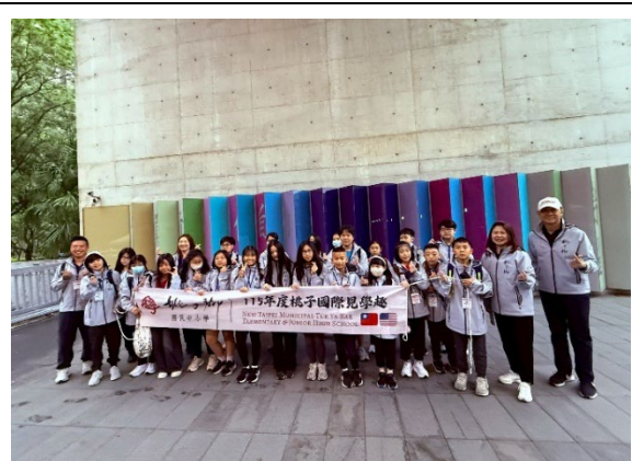
圖2(115/03/29)：校門口集合準備出發