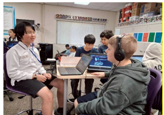
圖6(115/03/31)：Almond 小學與學伴分組學習