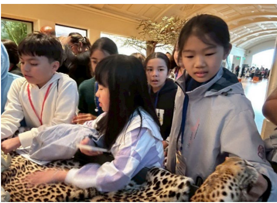
圖17(115/04/06)：參訪加州科學院，進行非洲區導覽解說體驗