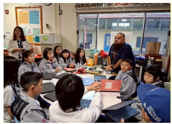
圖4(115/03/30)：Almond 小學第一天入班課程