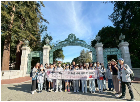
圖13(115/04/04)：參訪加州大學柏克萊分校