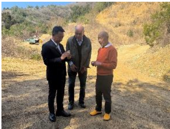
參訪砥部燒陶石採集礦場