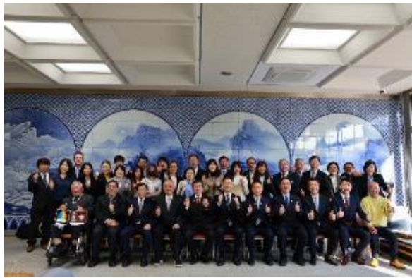
全員於砥部町場合影