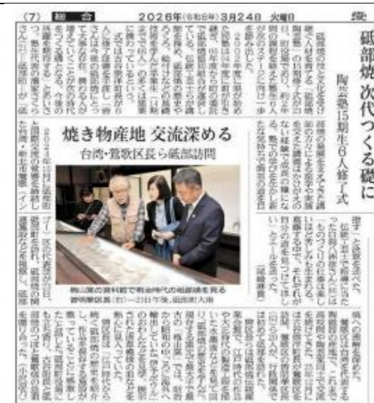
愛媛新聞報導本區交流內容