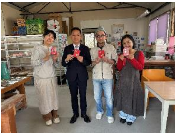
區長贈送侯市長之馬年福袋予三浦工房，並解釋福袋含意祝福大家好運旺旺來