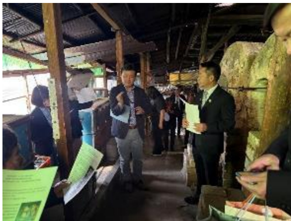
現勘白水窯現址愛媛大學教授現場說明