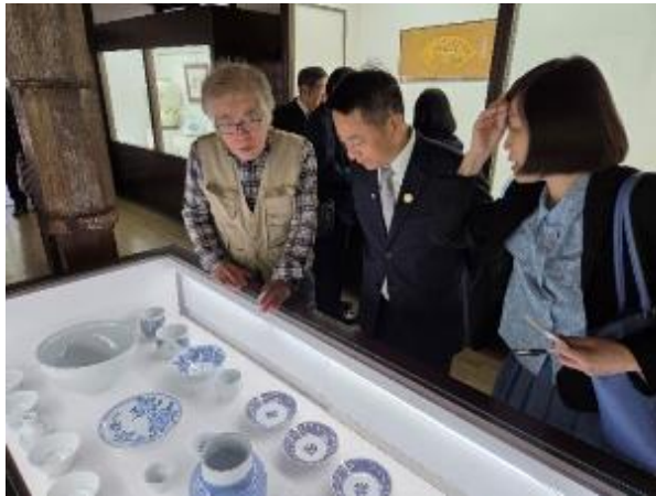
參訪梅山窯砥部燒歷史博物館