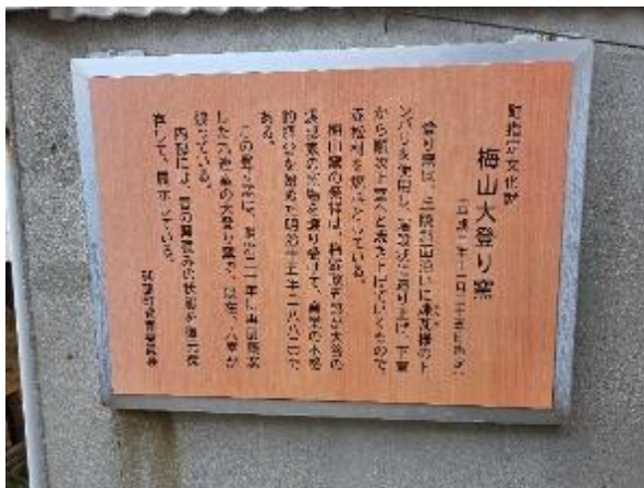
梅山窯大登窯被砥部町教育委員會認證指定為文化財