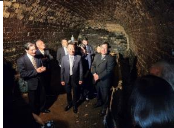
參訪梅山窯大登窯內部