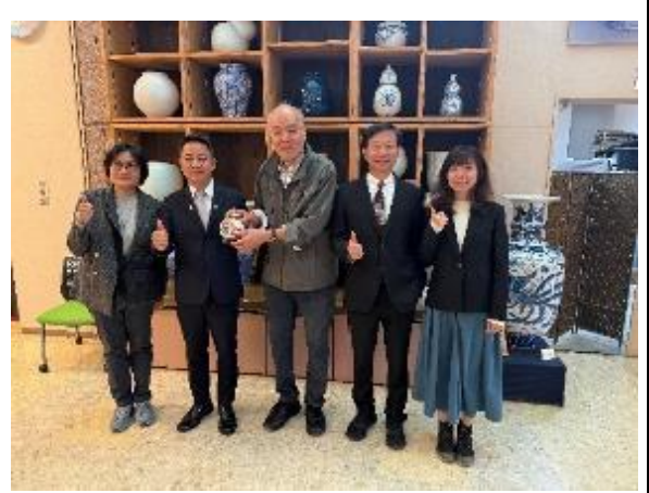
區長同團員致贈鶯歌陶瓷予千山窯