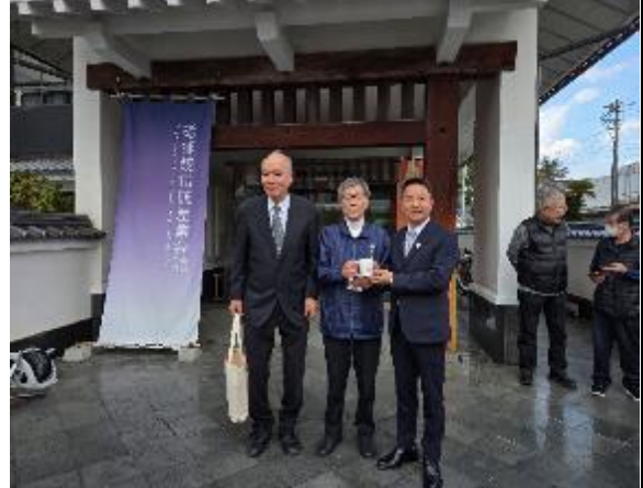
我方致贈砥部燒傳統產業會館館長來自 鶯歌的作品