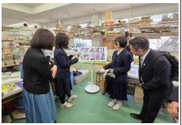
區長聽取松山南高校砥部分校學生簡報