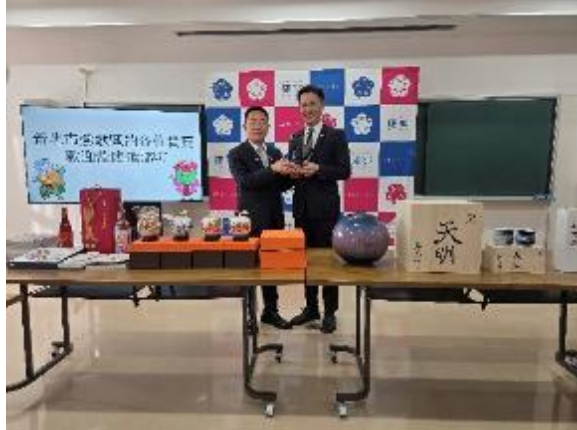
區長與砥部町長互贈禮品