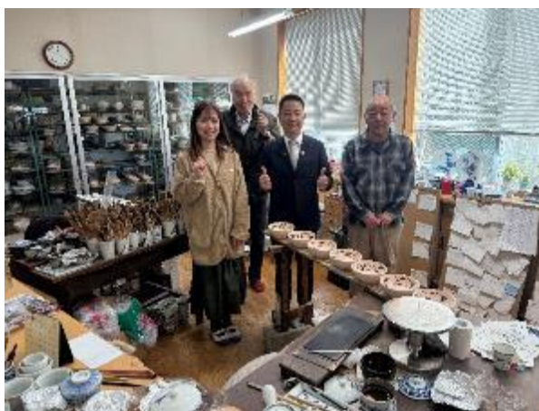
參訪千山窯陶燒彩繪工作室