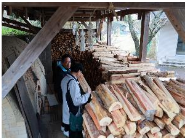
參訪內原野陶藝館柴燒窯