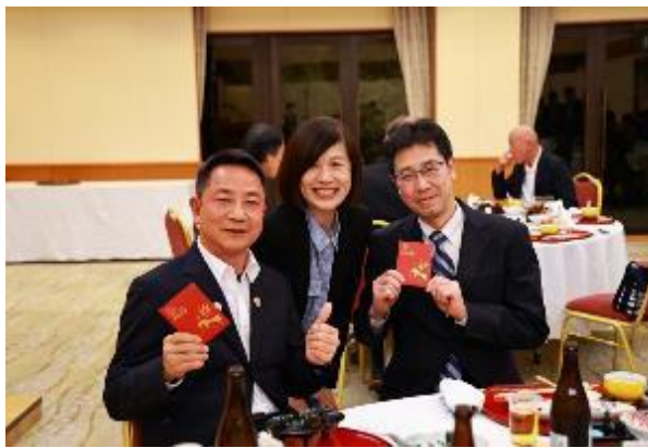
砥部町懇親會互動熱絡，區長贈予愛媛縣副知事侯市長馬年福袋