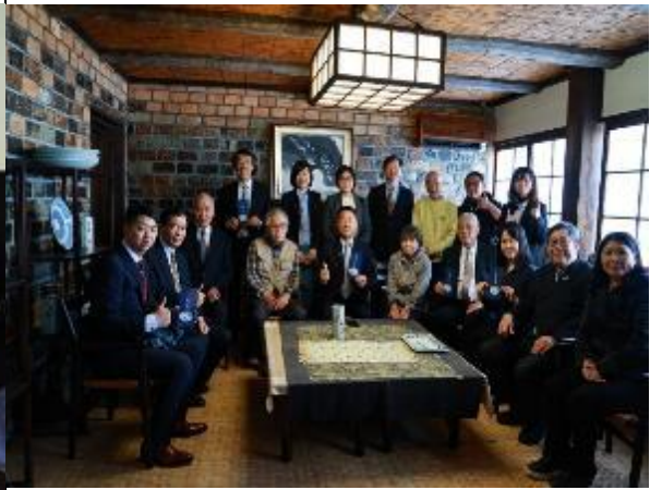
梅山窯業主開放招待過天皇之會客室接待我方團員