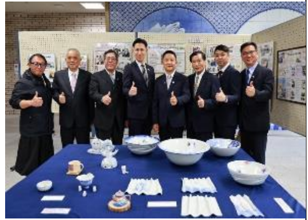
鶯歌區藝術家駐砥部町作品於砥部町役場展出