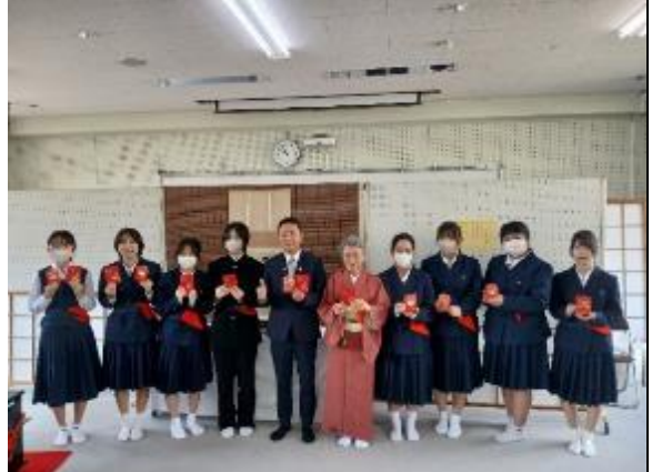
區長贈送侯市長馬年福袋予松山南高校砥部分校師生