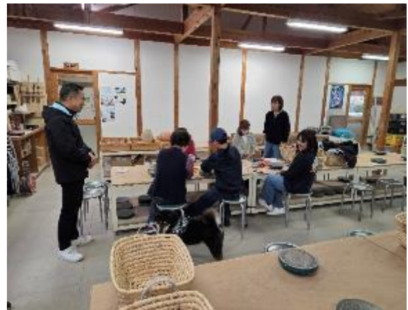
參訪內原野陶藝館現場實作體驗區