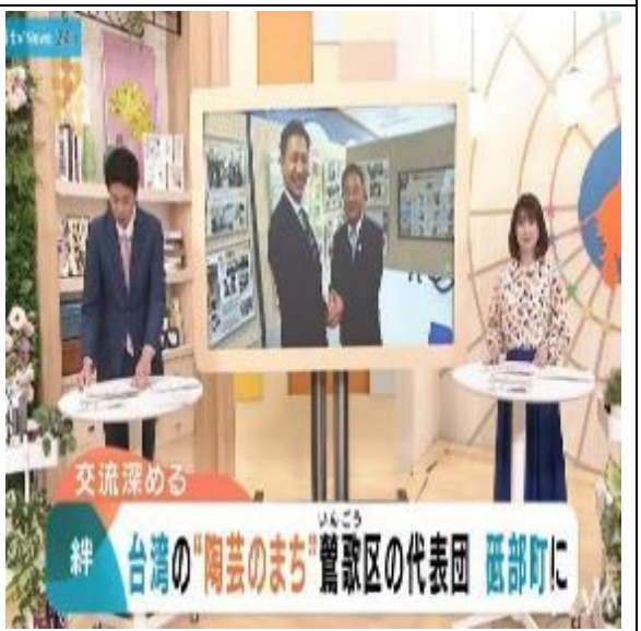
愛媛縣新聞媒體播放本區訪會消息新聞畫面