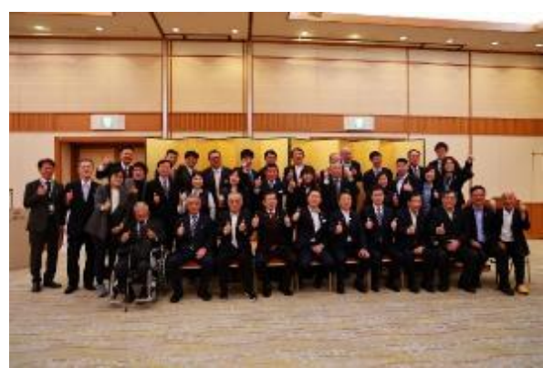
愛媛縣及砥部町招待懇親會結束合影