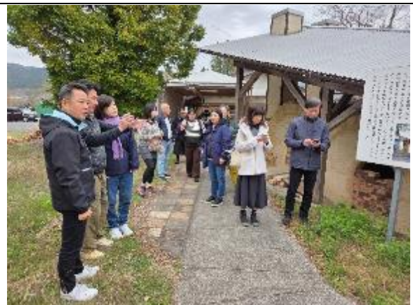
內原野陶藝館長現場導覽