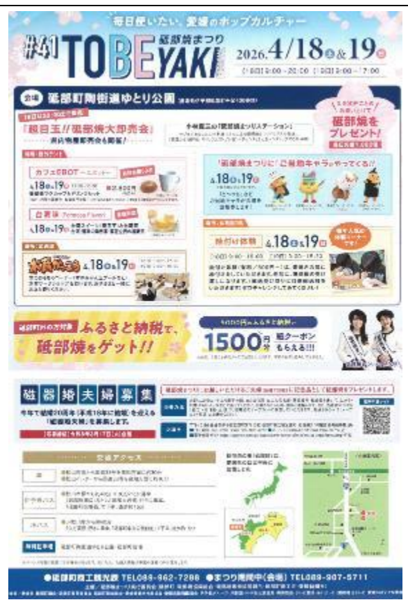
砥部焼祭（砥部焼活動）文宣正面内容 提及”台湾味”