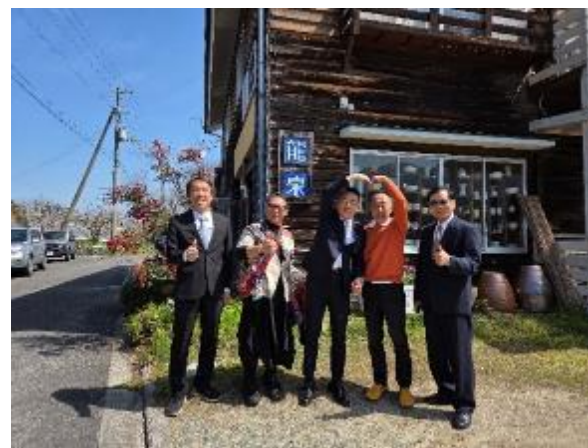
駐村藝術家同區長等人與池田大師於龍泉窯前合影