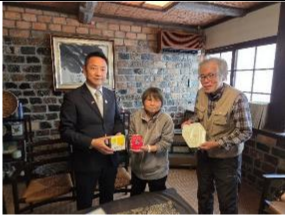
區長致贈梅山窯侯市長馬年福袋天燈造型瓷盤及台灣名點