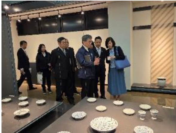
參訪砥部燒傳統產業會館