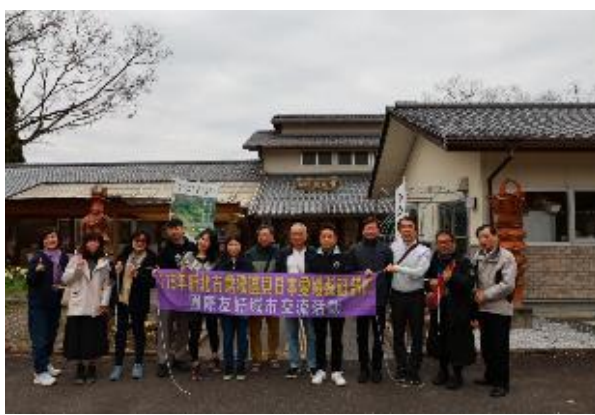
參訪內原野陶藝館全員合影