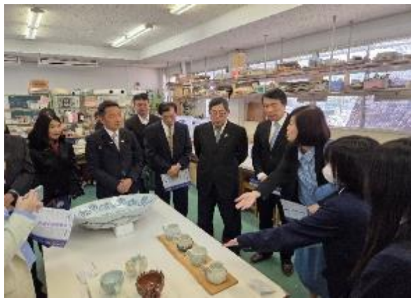
松山南高校砥部分校學生為區長介紹陶藝作品