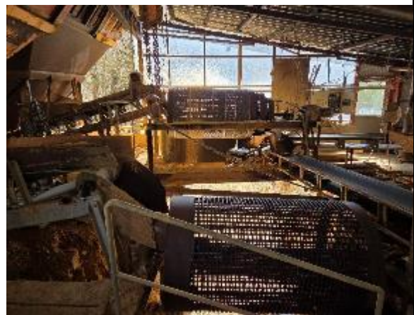
砥部燒陶石製作場（伊予鑛業所）