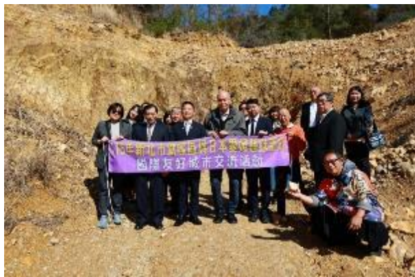
全員於砥部燒陶石採集現場合影