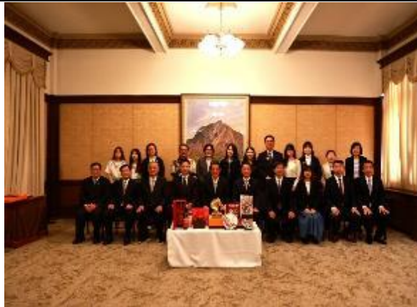
參訪團全員於愛媛縣廳合影