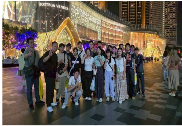
圖26-昭披耶河公主號遊覽湄南河經典夜景