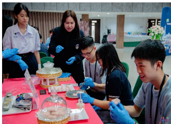
圖6-泰國傳統工藝工作坊