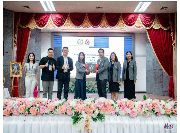
圖10-台泰學校兩方互贈紀念品