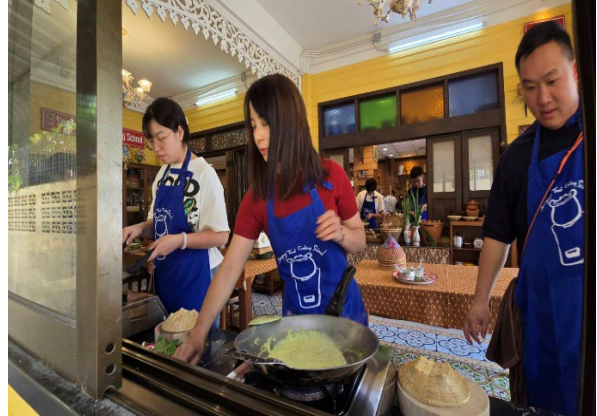
圖28-每個人都可以成功完成午餐料理