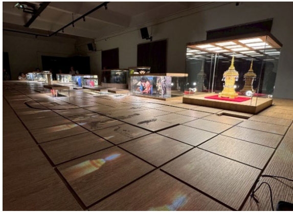
圖21-立體聲效泰國歷史介紹