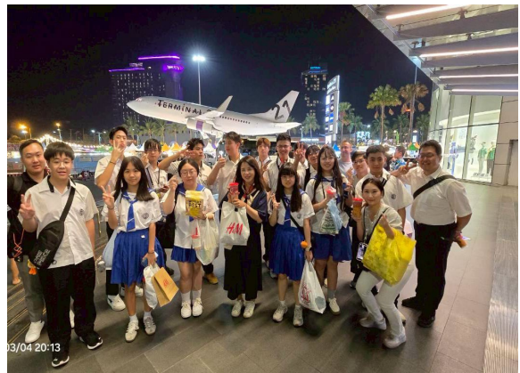
圖24-世紀航站百貨城環遊世界