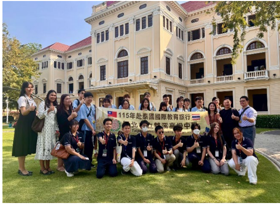
圖19-立體聲效泰國歷史介紹