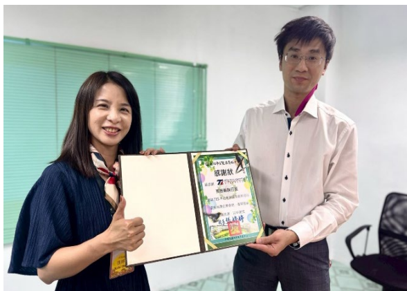
圖17-拜訪傑出亞洲台商「泰天寶」