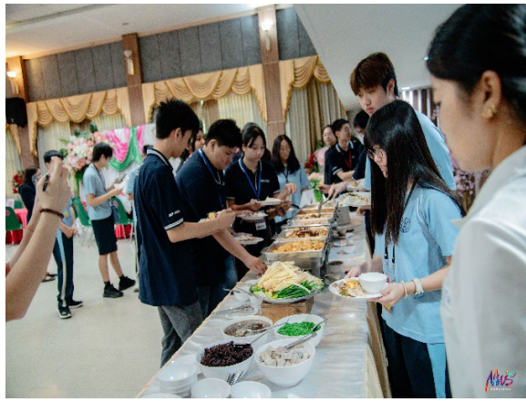
圖7-校內享用泰式午餐體驗