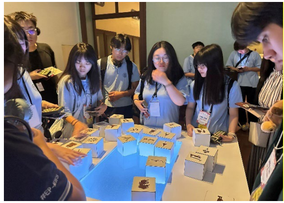
圖20-博物館趣味互動展區