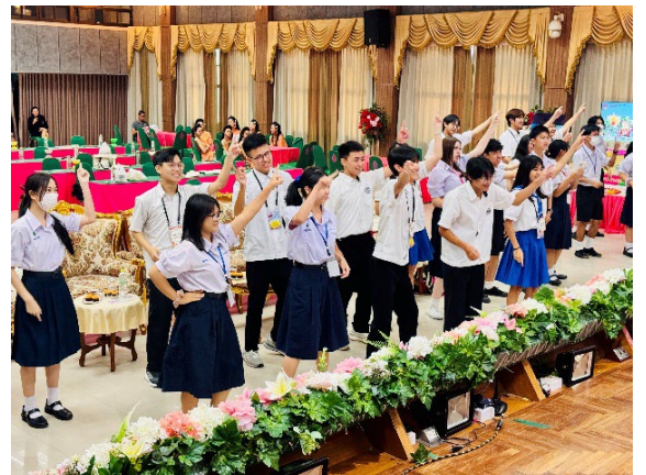
圖12-雙方學伴皆投入學習互動