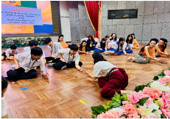
圖13-傳統男女泰舞教學互動