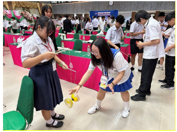
圖8-台灣扯鈴互動遊戲體驗