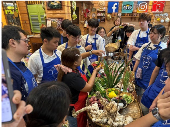
圖27-泰式料理廚房體驗下廚