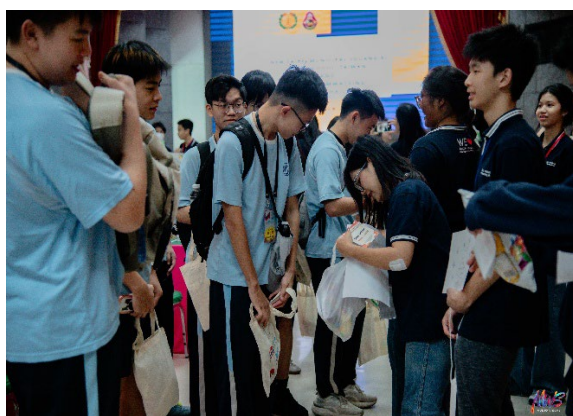
圖5-學伴相見歡與交換見面禮