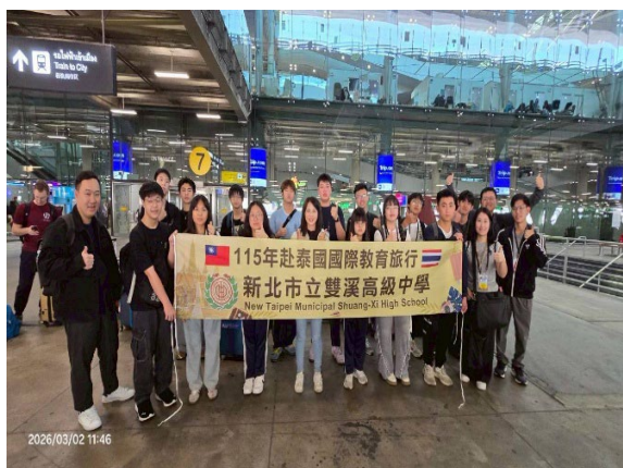
圖1-全員順利抵達泰國機場