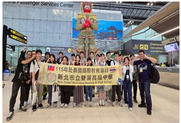
圖30-上機前於泰國機場大合照