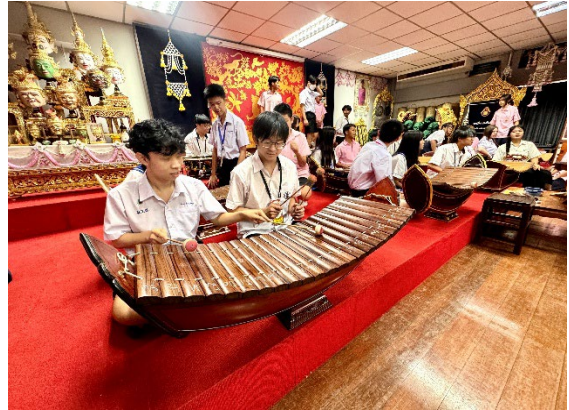
圖14-泰國傳統樂器體驗