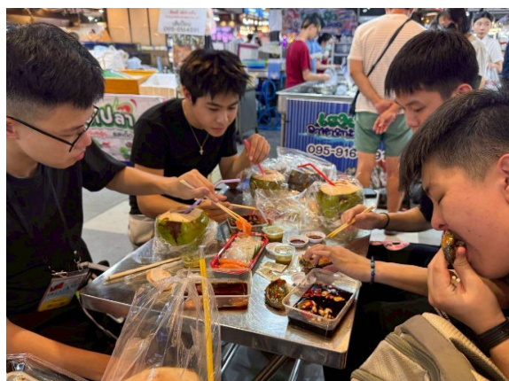
圖2-參訪吞武里海鮮市場