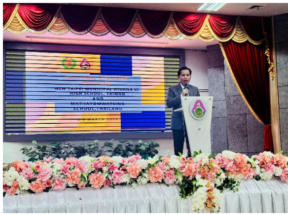
圖9-泰方校長主持歡迎儀式