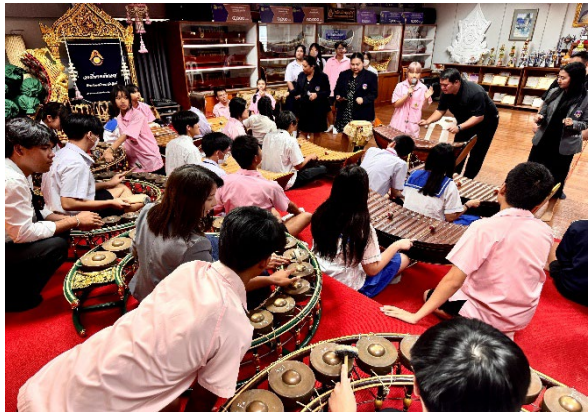
圖15-體驗泰國音樂特色美學