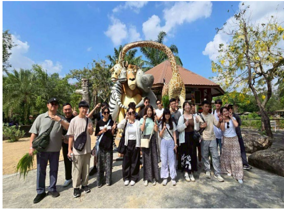
圖25-綠山動物園近距離接觸動物