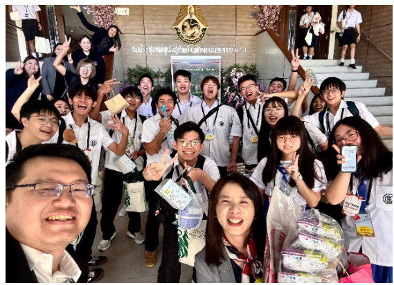
圖16-交換禮物離情依依達成國民外交