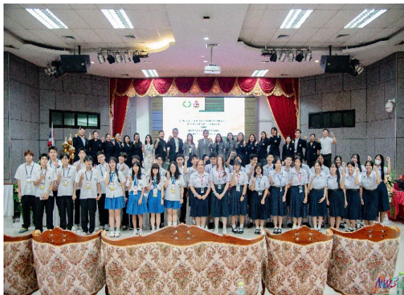
圖23-台泰師生交流大合照