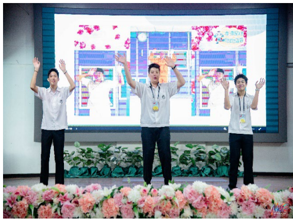
圖11-台灣經典歌曲跳動唱互動