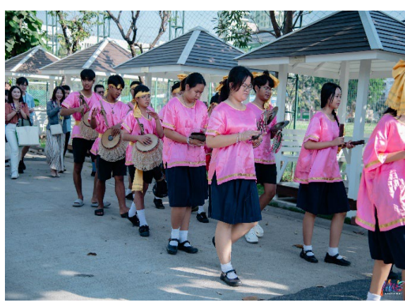
圖4-參訪 Mathayomwatsing School 高中