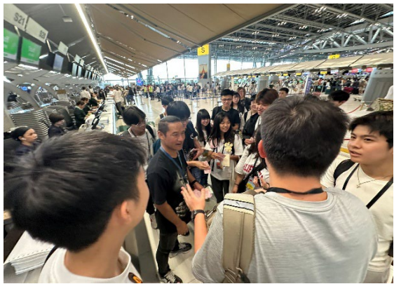
圖29-最後一天準時抵達機場