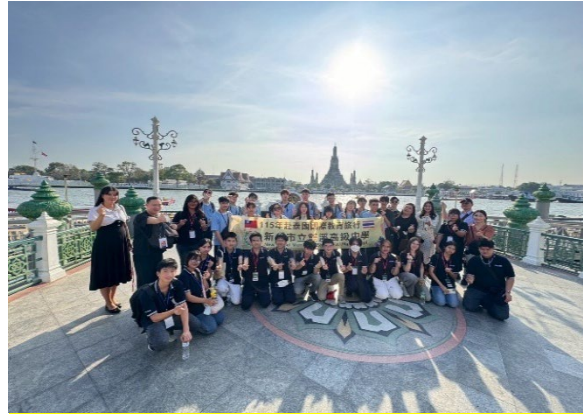
圖22-皇宮城區漫遊探訪