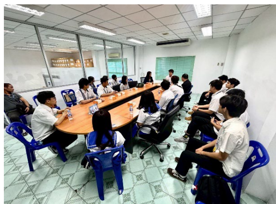
圖18-與台商對談深化學生國際職場力