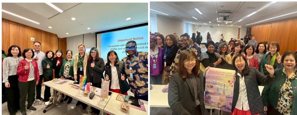
圖2.5 與談者及參與者與論談前後合影留念