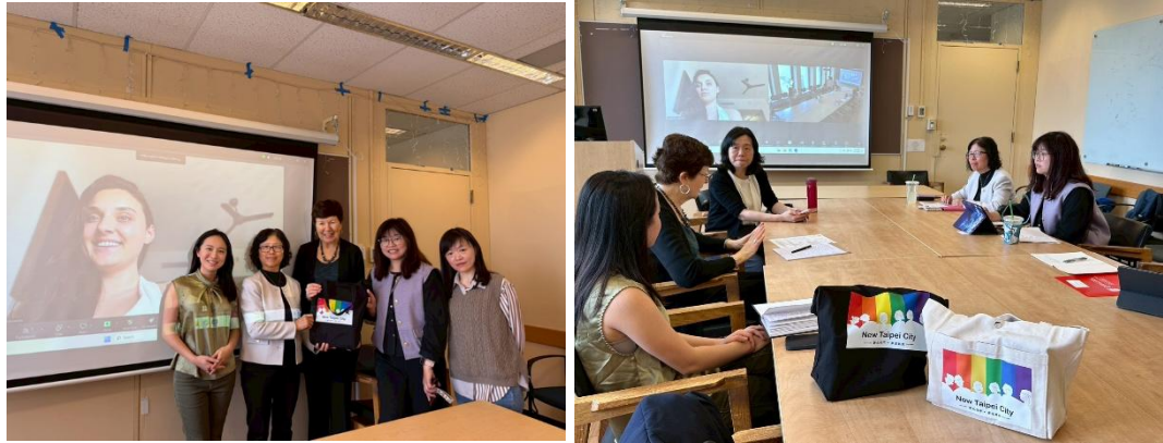
圖2.15 本局至哥倫比亞大學交流及與會者共同合影