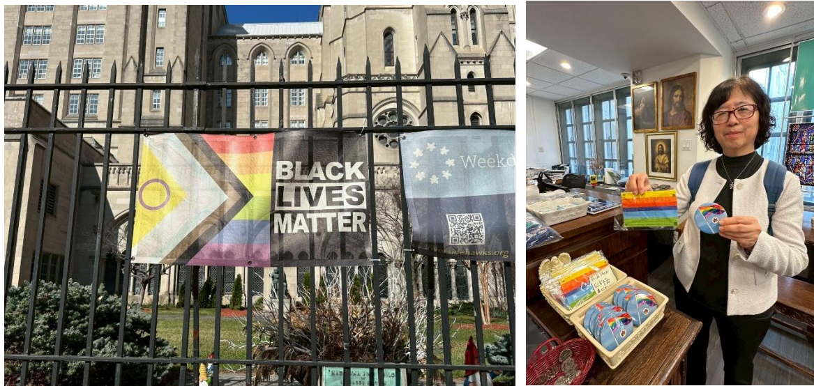
圖3.3 紐約河濱教堂懸掛性別友善旗幟及販賣周邊商品

雖美國當前政策趨向保守，然社會基層對於性別多元與包容之價值仍持續深化。觀察發現，部分原具保守立場之宗教場所，已逐漸懸掛性別友善旗幟以示包容。此外，在性別友善空間之建置上，公共場域之生理用品發送設備，不僅提供傳統衛生棉，亦普遍涵蓋衛生棉條等多樣化選項，落實尊重使用者習慣之實質友善。此種細緻化之服務思維，可作為未來新北市推動性別平等政策與空間規劃之參考。