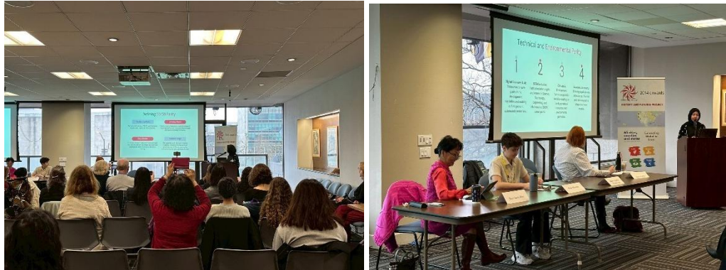
圖2.9 3月16日論壇講者分享 CEDAW 內涵及重要性

講者分享後，則邀請參與者進行小組討論，鼓勵各國與會的年輕女性，共同討論在學校和社群內發現的重要性別議題，並如何運用 CEDAW 及發揮女性領導力解決相關困境。