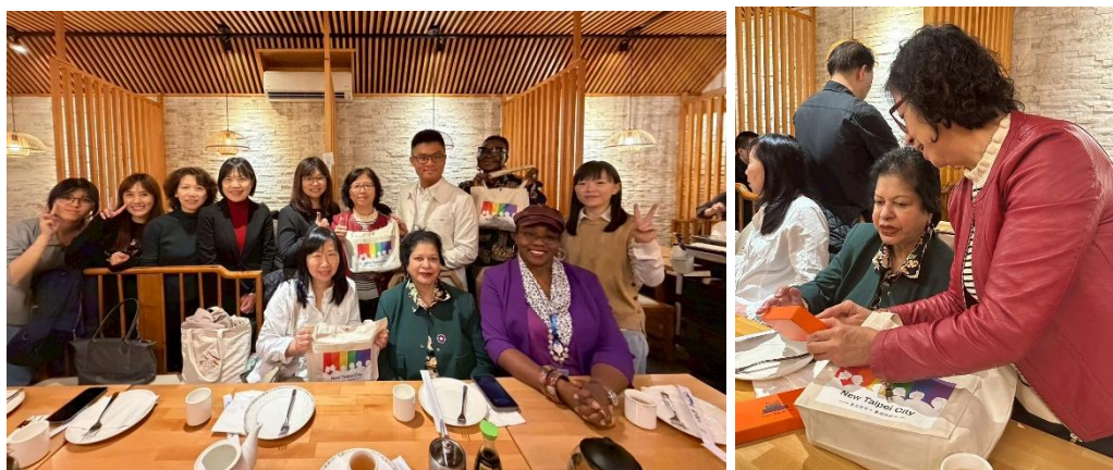
圖2.6 論壇後與談者們餐敘以促進及深化雙方交流