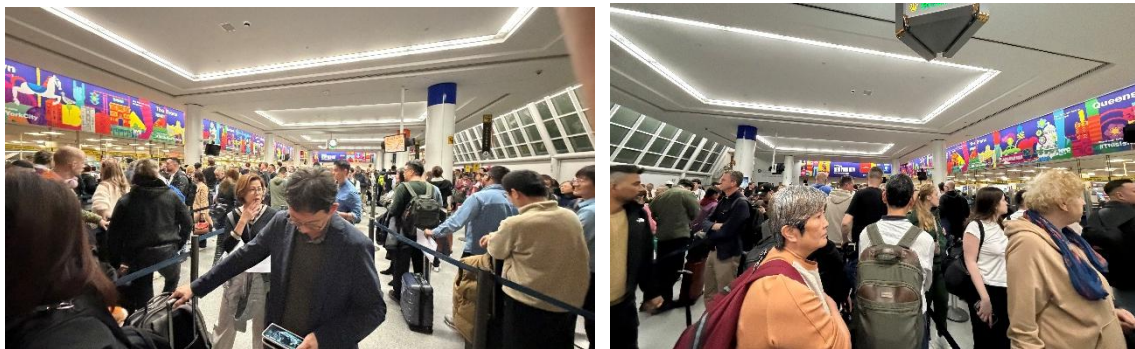
圖3.2 本局出訪人員入境美國候關時人潮眾多

本局代表於美東時間3月9日晚間抵達紐約甘迺迪機場，受限於通關窗口配置不足與作業程序緩慢，入境人潮壅塞，致使團隊候關時間長達4小時。相較之下，我國機場通關效率與公務機關之服務動能明顯優於該國。此一經驗不僅體現我國公務人員專業素質與對民意訴求之即時回應能力，亦彰顯行政體系在效率管理上之優勢。