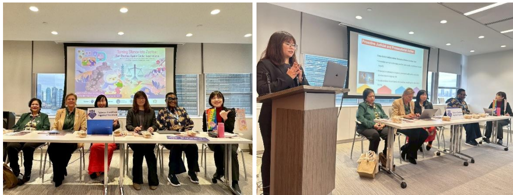
圖2.4 本府家防中心督導分享性別暴力防治業務推動經驗