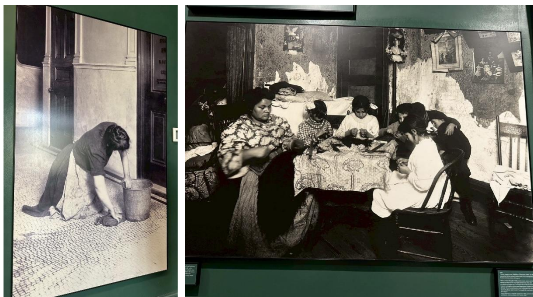
圖2.14 照片檔案紀錄女性移民勞動參與情形

然而雖然當時社會氛圍多將女性視為依附者，但博物館透過照片與數據展示了大量女性移民進入紡織廠、家庭手工藝的歷史，呈現移民女性的勞動參與情形及對經濟力的貢獻；另外紀錄中也呈現，許多女性在被扣留期間組織起來互相扶持，或是在入境後成為爭取勞工權益與婦女參政權的先驅，可見在策展內中不再只是強調女性受壓迫的「被審查者」角色，更進而呈現移民女性的韌性及主動性。