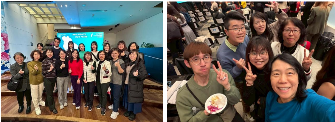
圖3.1 各縣市政府出訪代表相互交流及共同合影

參與本次國際會議過程中，見證臺灣在性別平等議題上的高度凝聚力。除中央部會積極參與外，地方政府參與情形亦相當踴躍，包含新北市在內之六都（除臺南市外）均派員出席。嘉義市長更親自率隊發表報告，展現首長對性平議題之重視。此外，民間團體之動能亦不容小覷，今年共有31個單位參與，申請辦理31場以上平行論壇，其中包含28場實體會議，積極向國際社會展示臺灣在推動 CEDAW 在地化及婦女權益保障之卓越成果，深獲國際肯定。