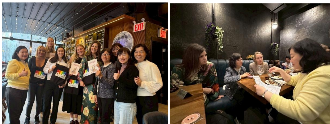
圖2.13 本局贈送本市 CEDAW 城市報告並與 WGI 代表交流

綜上，在 CEDAW 公約的落實及性平政策的建置上，我國進展程度較美國洛杉磯類似國際城市為前，推動女性參與公共決策制度化較其為成熟，但限於公務人員給薪標準的統一性，在推動機制上提供薪資加給做為獎勵手段的可能性則較為受限。因此未來如何持續提升首長對於性平政策的支持，與加強對各部門的要求規範，以及持續提供各部門同仁實質的鼓勵做為誘因，則為本府推動性別主流化業務的倡議方向之一。