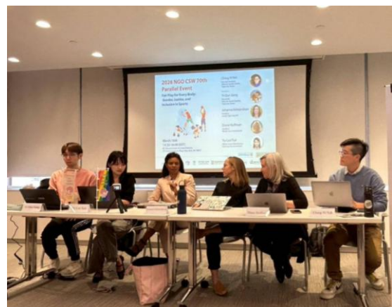
圖2.1 臺北市性平辦主辦論壇之講者資訊及會上合影