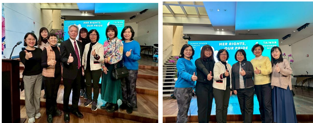
圖2.12 本局出席晚會並與外交部、NGO 及其他縣市交流