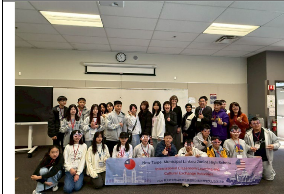
圖 11(115/1/26)：學生於 Metro ED 進行職業試探(1)