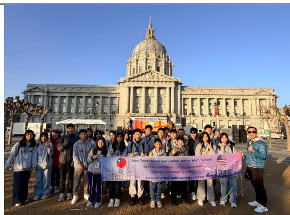
圖 3(115/1/24)：參訪舊金山市政廳