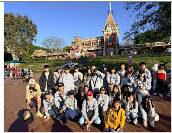
圖 46(115/2/2)：體驗美國樂園商業模式- 迪士尼樂園