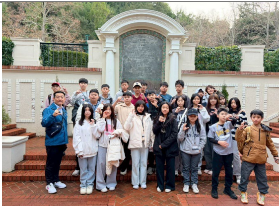
圖 27(115/1/28)：參訪舊金山市長官邸(1)