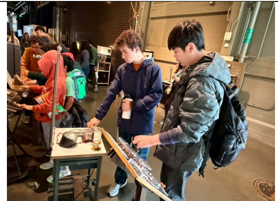
圖 30(115/1/29)：與姊妹校學伴於探索博物館共學(2)