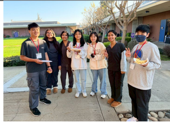
圖 12(115/1/26)：學生於 Metro ED 進行職業試探(2)