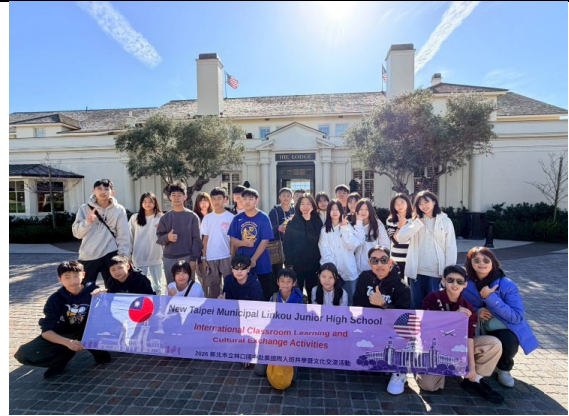
圖 44(115/2/1)：參訪泡沫灣高爾夫球場