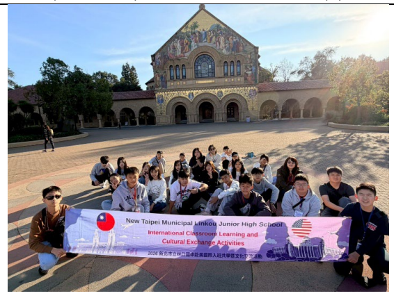
圖 22(115/1/26)：參訪史丹佛大學(6)