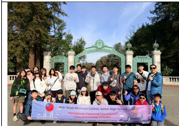
圖 35(115/1/31)：參訪柏克萊大學(1)