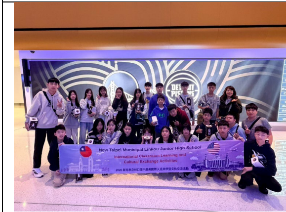
圖 33(115/1/30)：體驗美國體育文化-觀看 NBA 球賽(1)