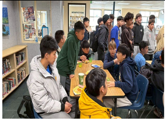
圖 24(115/1/27)：於姊妹校 Egan 中學入班共學(2)