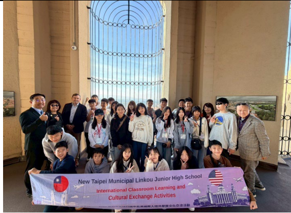
圖 19(115/1/26)：參訪史丹佛大學(3)