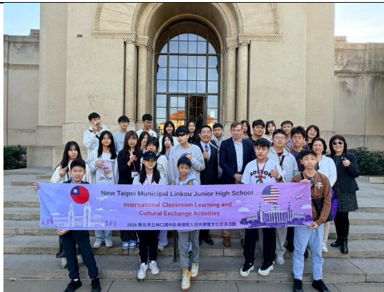
圖 17(115/1/26)：參訪史丹佛大學(1)