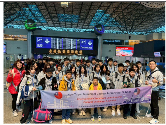
圖 48(115/2/4)：平安抵達台灣桃園機場