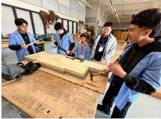
圖 13(115/1/26)：學生於 Metro ED 進行職業試探(3)