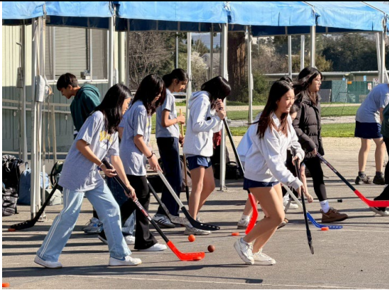
圖 23(115/1/27)：於姊妹校 Egan 中學入班共學(1)