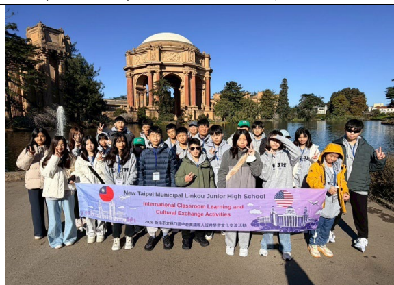
圖 5(115/1/24)：參訪舊金山藝術宮