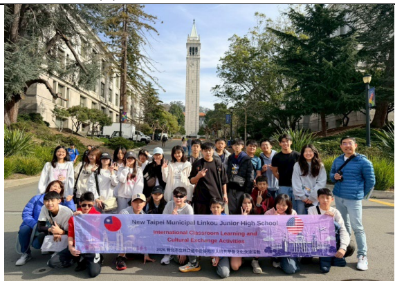
圖 36(115/1/31)：參訪柏克萊大學(2)