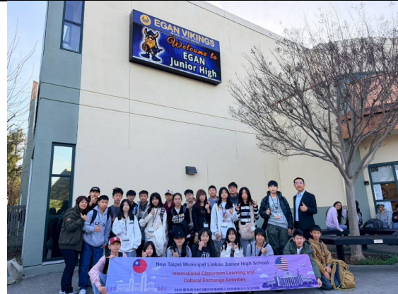
圖 26(115/1/28)：於姊妹校 Egan 中學入班共學(4)