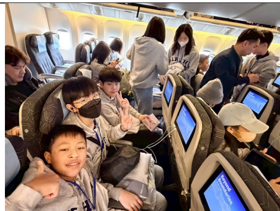
圖 47(115/2/3)：搭機返回台灣-航程中