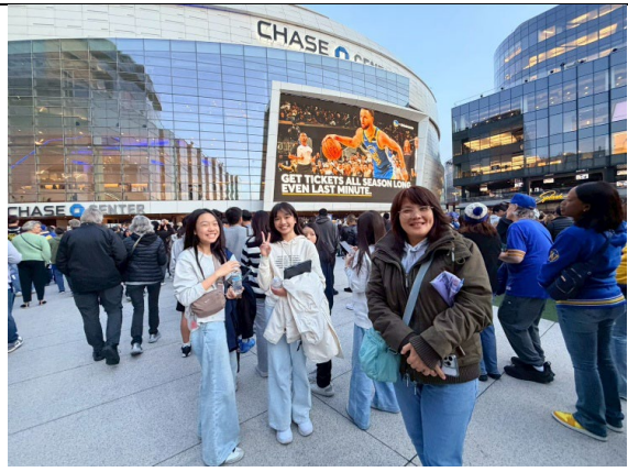
圖 34(115/1/30)：體驗美國體育文化-觀看 NBA 球賽(2)