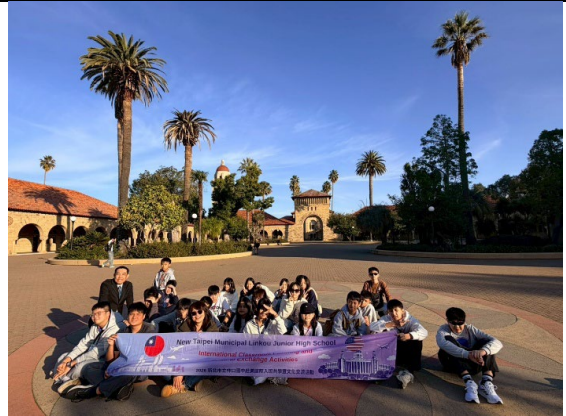
圖 20(115/1/26)：參訪史丹佛大學(4)