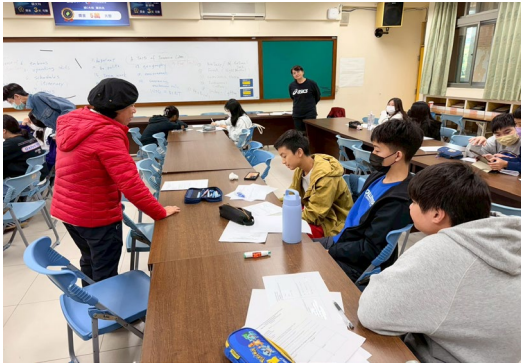
圖 1 行前美國文化培訓課程(1)

為了讓同學在參訪過程中能有更多收穫，特別在出發前安排了 18 個小時的美國文化與生活美語的課程以及行銷臺灣特色文化課程(圖 1 及圖 2)。此一課程不僅美國禮儀及簡介各景點，同時也教導簡單生活美語，以方便同學交流所需；也讓學生深入瞭解臺灣值得行銷的文化特色、制度與美食。