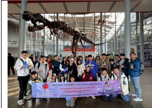
圖 9(115/1/25)：參訪加州科學院(1)