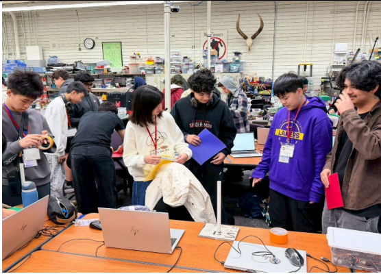
圖 15(115/1/26)：學生於 Metro ED 進行職業試探(5)