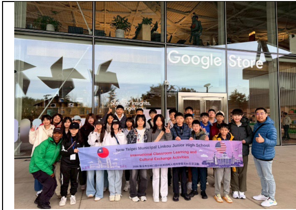
圖 7(115/1/25)：參訪 Google 全球總部(1)