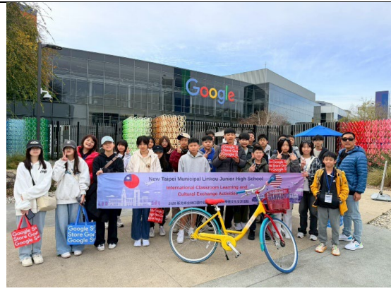
圖 8(115/1/25)：參訪 Google 全球總部(2)