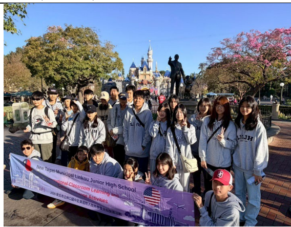
圖 45(115/2/2)：體驗美國樂園商業模式- 迪士尼樂園