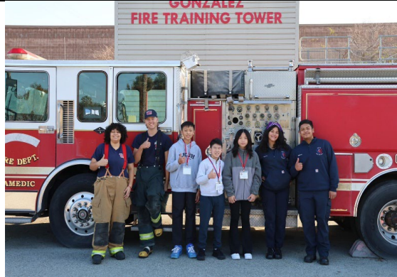
圖 16(115/1/26)：學生於 Metro ED 進行職業試探(6)