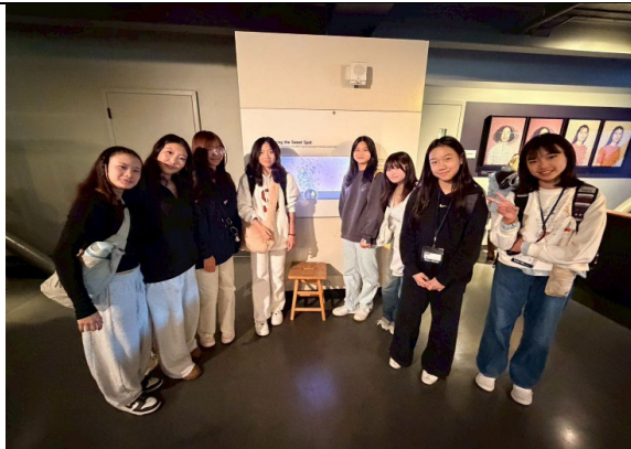
圖 29(115/1/29)：與姊妹校學伴於探索博物館共學(1)