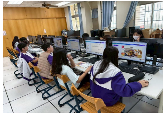
圖 2 行前美國文化培訓課程(2)