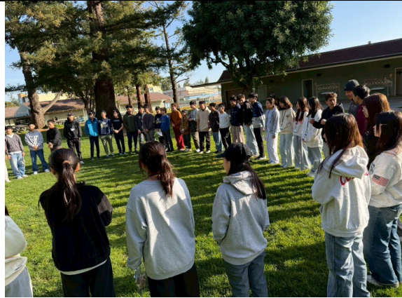
圖 25(115/1/28)：於姊妹校 Egan 中學入班共學(3)