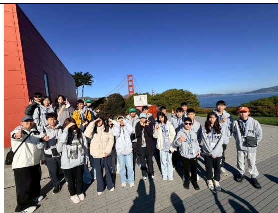
圖 4(115/1/24)：參訪舊金山大橋紀念公園