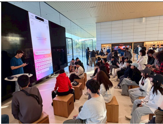
圖 39(115/1/31)：參訪 Apple 全球總部(2)