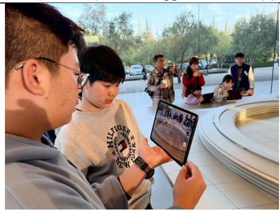
圖 40(115/1/31)：參訪 Apple 全球總部(3)