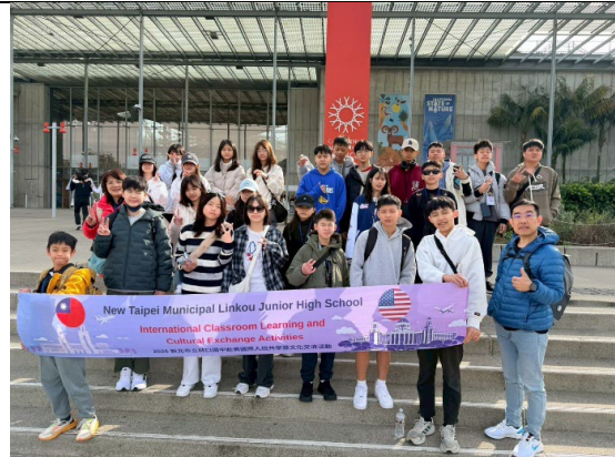
圖 10(115/1/25)：參訪加州科學院(2)