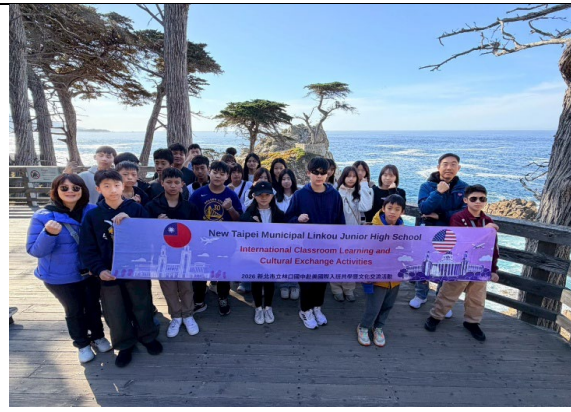
圖 42(115/2/1)：參訪 17-miles 景觀道路