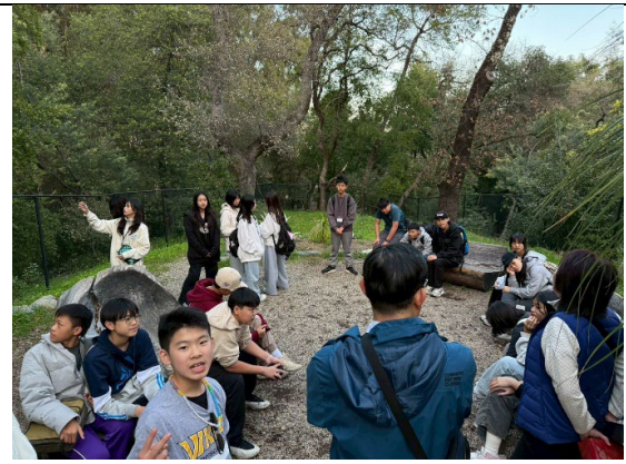
圖 28(115/1/28)：參訪舊金山市長官邸(2)