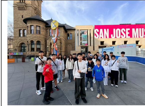
圖 37(115/1/31)：參訪聖荷西美術館