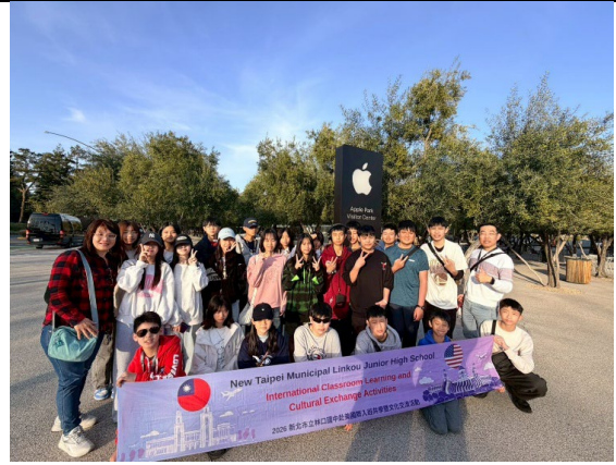
圖 38(115/1/31)：參訪 Apple 全球總部(1)