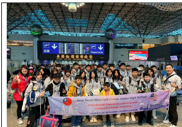
圖 1(115/1/24)：學生出發前於桃園機場集合