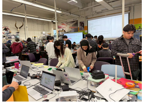
圖 14(115/1/26)：學生於 Metro ED 進行職業試探(4)