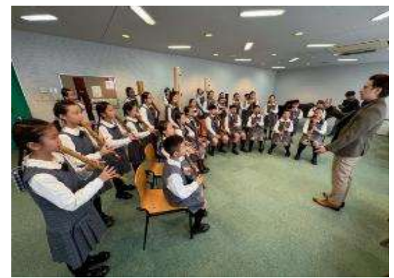
圖 5 比賽會場~賽前練習