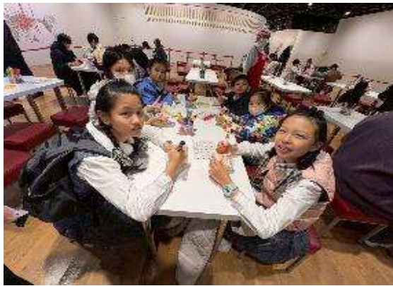
圖 9 日清泡麵博物館~自己做泡麵