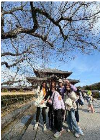
圖 15 世界遺產~~東大寺