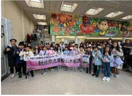
圖 1 桃園機場準備登機