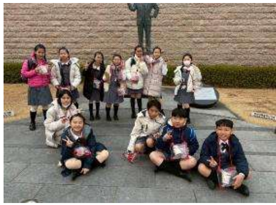
圖 10 日清泡麵創始人拍張合照