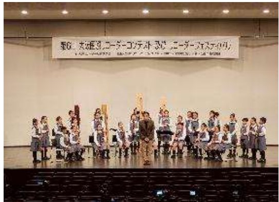
圖 6 正式登場比賽