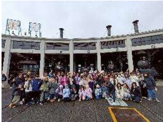
圖 13 京都鐵道博物館