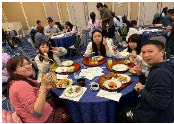
圖 3 享用美味晚餐