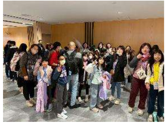
圖 2 抵達關西國際空港