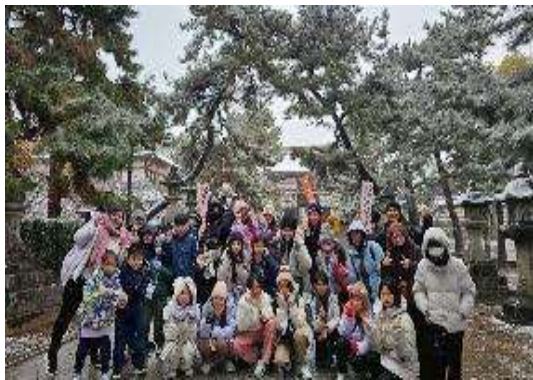
圖 11 北野天滿宮合照