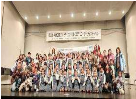
圖 7 榮獲金賞獎