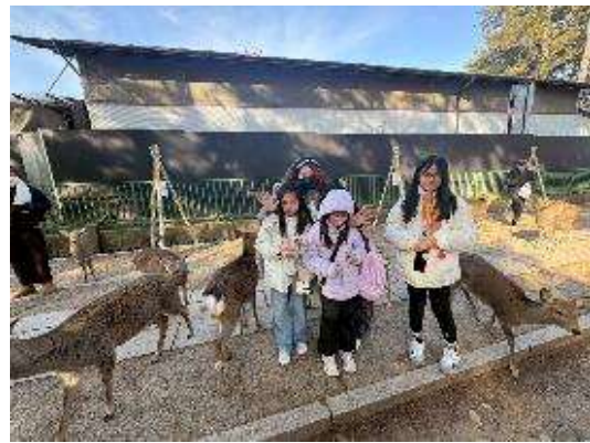
圖 16 奈良梅花鹿公園餵貪吃的小鹿