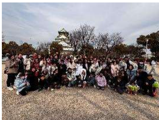
圖 17 展現日本戰國時代的建築與歷史~~ 大阪城公園