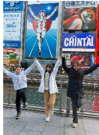
圖 14 心齋橋之跑跑人