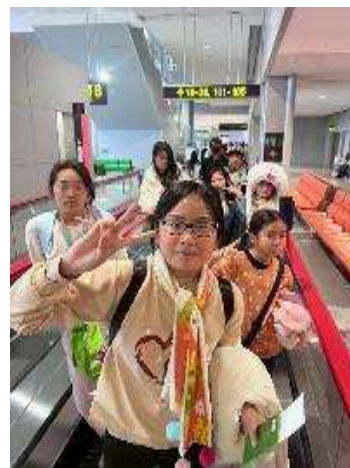
圖 18 回程返台