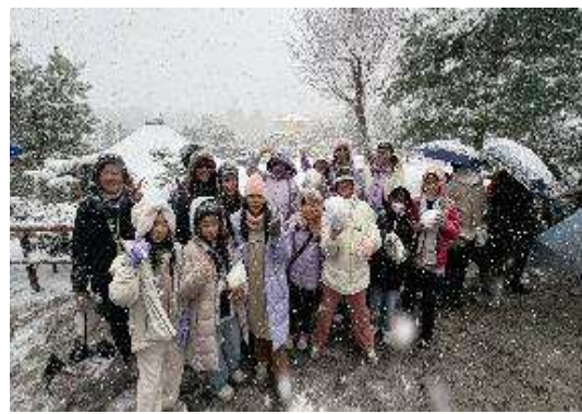
圖 12 金閣寺，遇到雪景