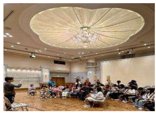
圖 4 賽前前一晚，於飯店宴會廳練習