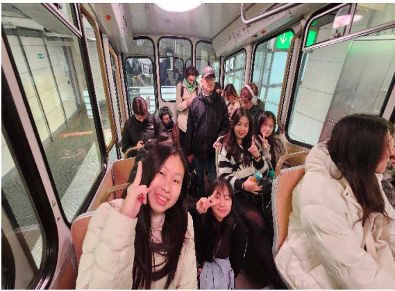
圖15(115/02/03)：學生搭乘纜車上富維耶聖母院。