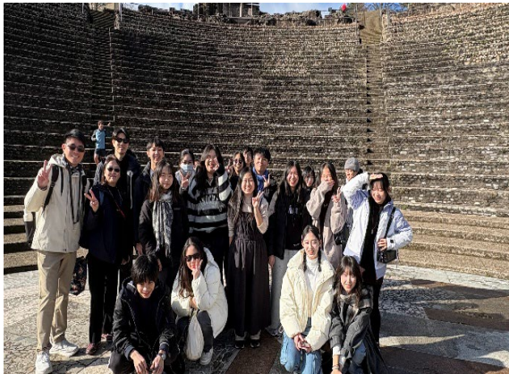
圖17(115/02/03)：學生合影於古羅馬劇場遺址。