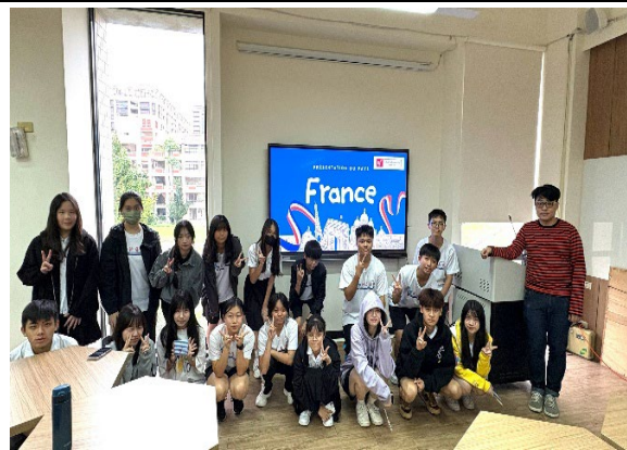
圖1(114/10/31)：本校邀請法國文化協會，分享法國歷史文化及地理特色。