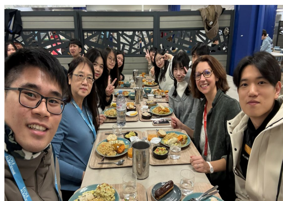
圖5(115/01/26)：師生於學生餐廳用餐。