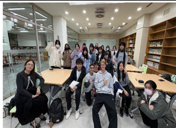
圖2(115/01/21)：行前說明會暨法國交換生經驗分享。