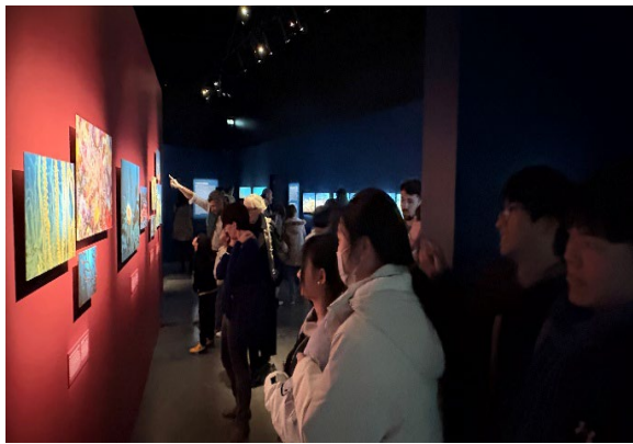
圖12(115/02/01)：學生於匯流博物館看展覽。