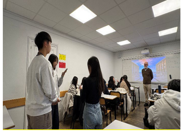
圖8(115/01/28)：入校體驗法語課程，學生於最後一堂課發表學習成果。