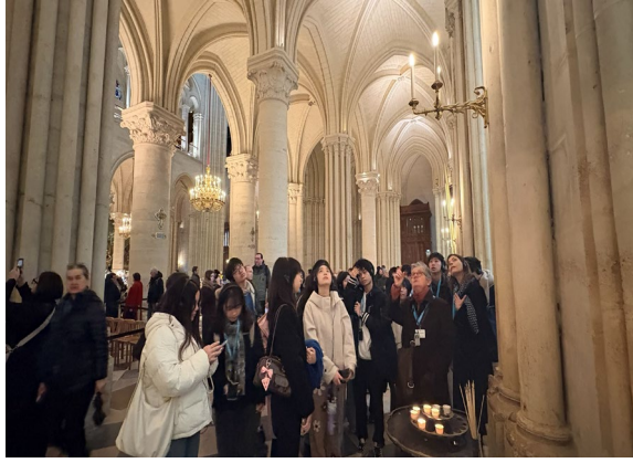
圖7(115/01/27)：學生於聖母院欣賞彩色玻璃。