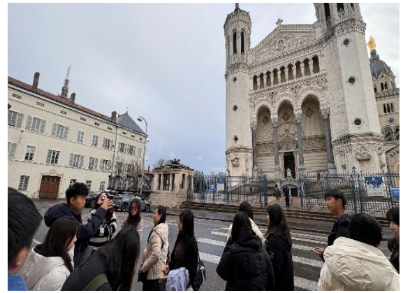
圖16(115/02/03)：學生聆聽富維耶聖母院的歷史。