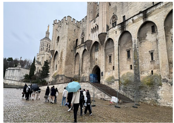
圖11(115/01/31)：學生漫步於亞維儂老城區。