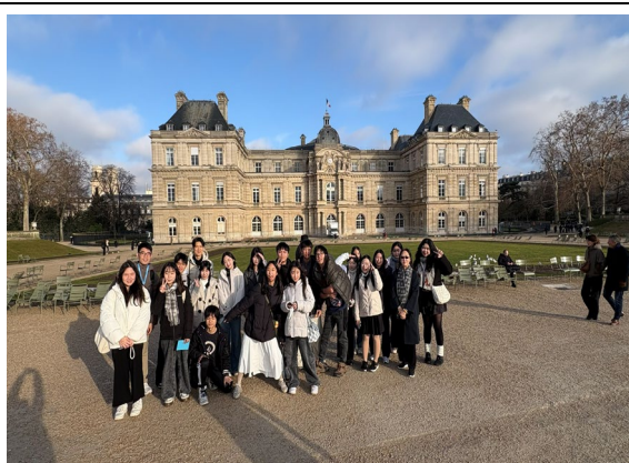
圖4(115/01/26)：師生於盧森堡公園合影。