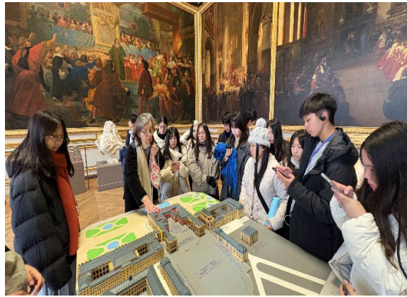
圖9(115/01/29)：在專業導覽員的解說下參訪凡爾賽宮。