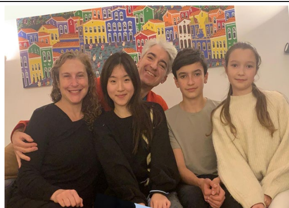
圖3(115/01/25)：學生體驗寄宿家庭生活。