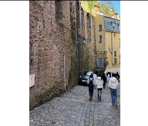
圖18(115/02/03)：學生漫步欣賞吉爾吉勇斜坡。