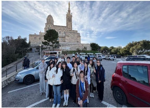
圖10(115/01/30)：學生於守護聖母聖殿外合影。