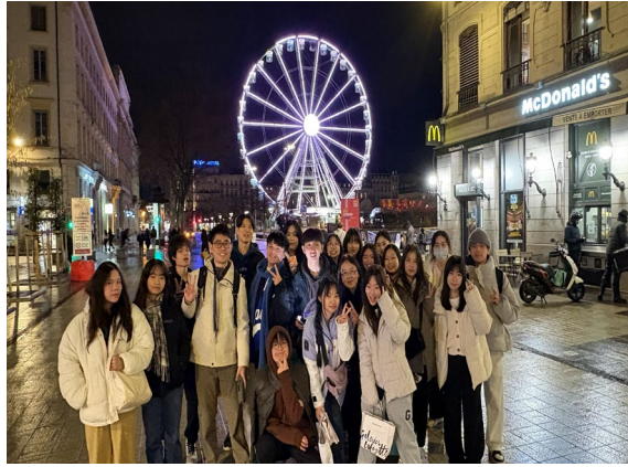
圖13(115/02/01)：師生傍晚於共和國廣場散步。