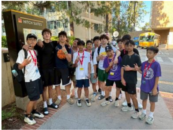
圖43(114/7/16)：學生於 UCLA 與外國學生一起進行體育課程