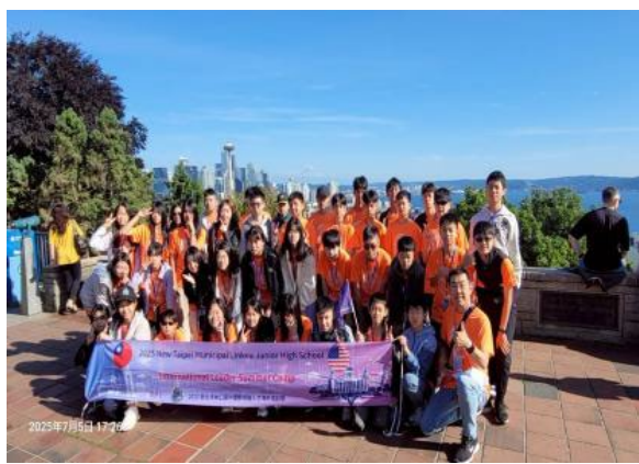
圖12(114/7/5)：學生於西雅圖高地欣賞城市景觀