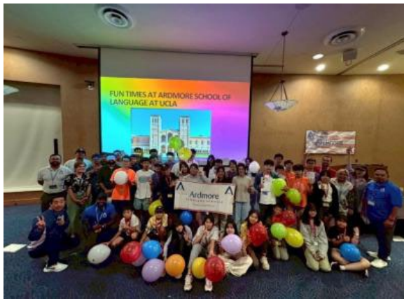
圖49(114/7/19)：學生於 UCLA 語言課程結束，辦理結業式並頒發結業證書