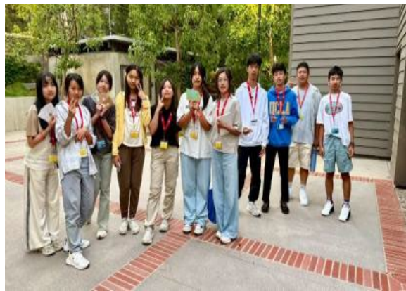
圖51(114/7/19)：學生於 UCLA 語言課程結束，準備臺灣意象的感謝卡致贈授課外國教師