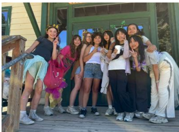
圖29(114/7/11)：學生於 Campfire 與外國學生一起進行領導力課程