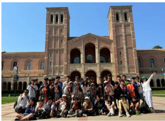
圖39(114/7/14)：學生於 UCLA 大學進行校園導覽課程