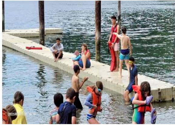
圖25(114/7/9)：學生於 Campfire 營地進行水域課程與問題解決課程