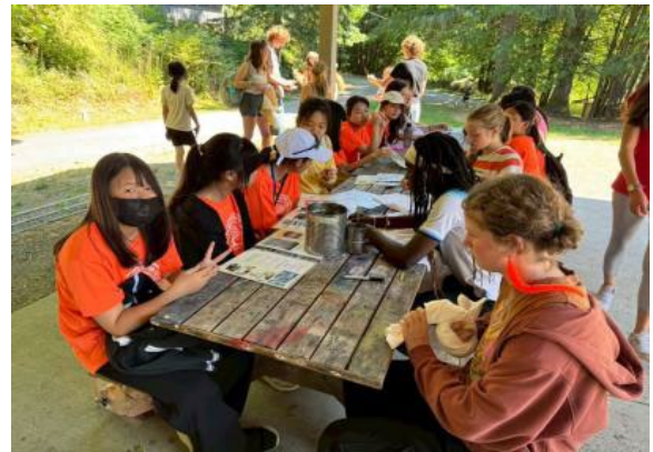
圖24(114/7/8)：學生於 Campfire 與外國學生一起進行蠟染藝術創作