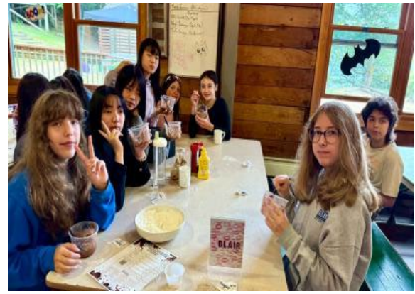
圖26(114/7/9)：學生於 Campfire 與外國學生一起進行異國料理創作