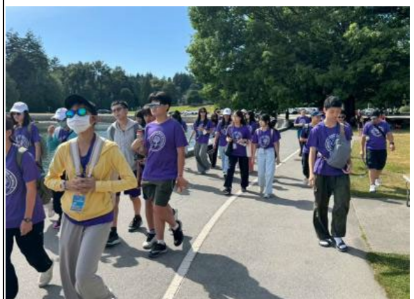
圖6(114/7/4)：學生於溫哥華史丹利公園生態參訪