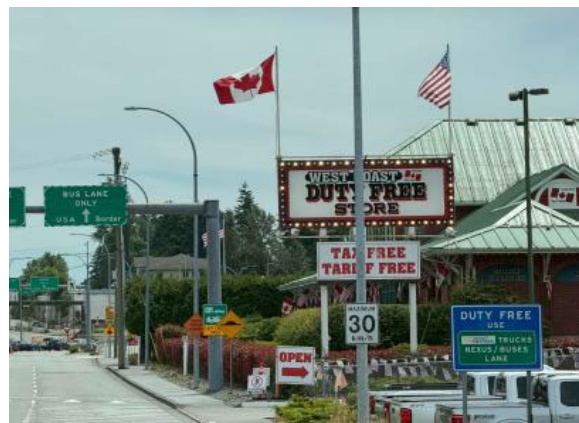
圖11(114/7/5)：本團師生通過美加邊境進入美國