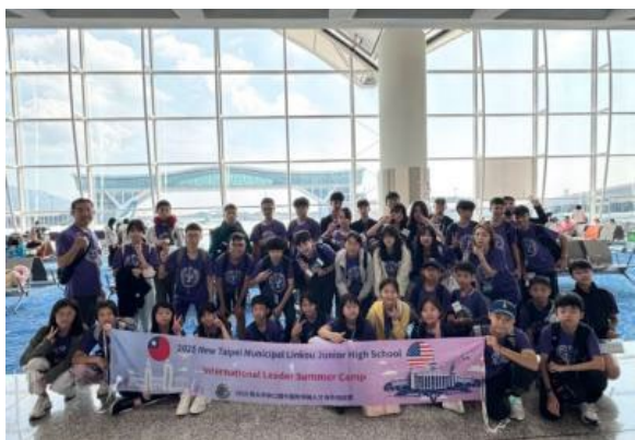
圖65(114/7/23)：學生於洛杉磯國際機場準備搭機返回臺灣