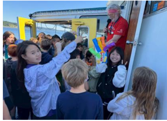
圖19(114/7/7)：學生搭船前往 Campfire 營地