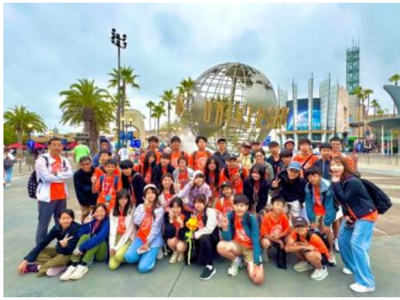
圖61(114/7/21)：學生於加州環球影城學習電影製作與商業運作模式