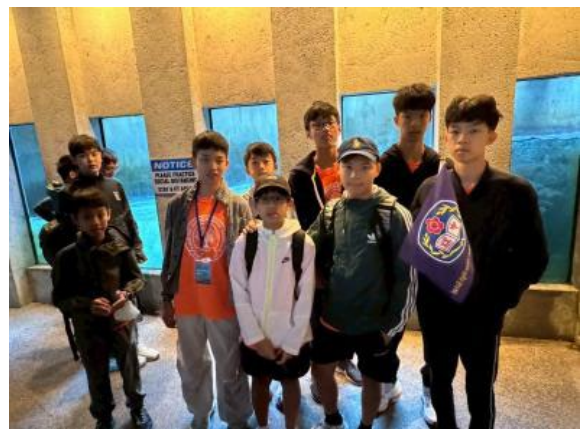
圖8(114/7/5)：學生前往鮭魚孵化場參訪鮭魚生態