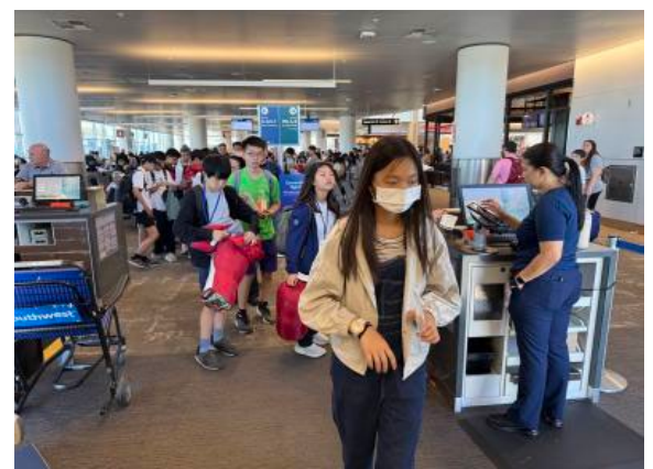
圖36(114/7/12)：學生結束 Campfire 課程，前往西雅圖機場，準備搭機前往洛杉磯