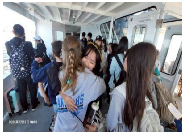
圖34(114/7/12)：學生於 Campfire 課程結束與外國學生歡送話別擁抱