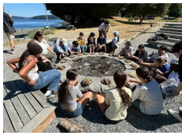
圖30(114/7/11)：學生於 Campfire 與外國學生一起進行野外求生與定向課程