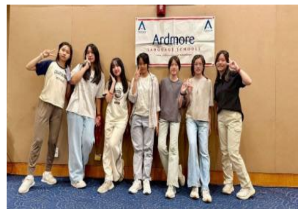
圖54(114/7/19)：學生於 UCLA 語言課程結束，與同組同學合影留念