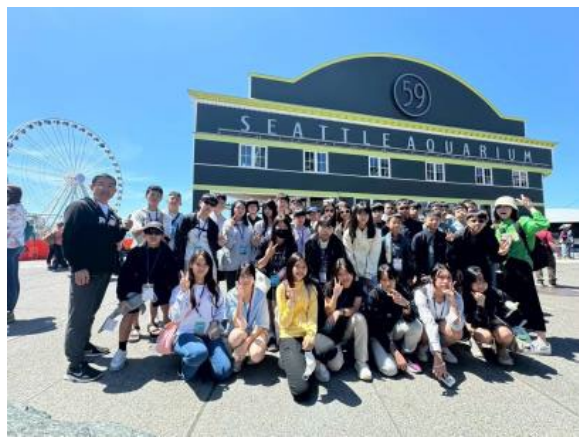
圖15(114/7/6)：學生於西雅圖水族館進行生態學習