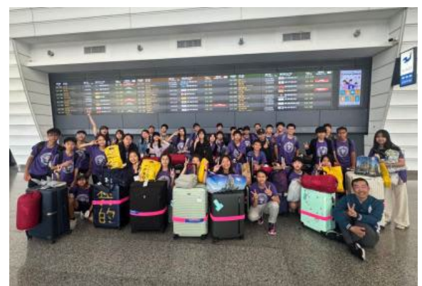
圖66(114/7/24)：學生搭機回到桃園機場，準備回溫暖的家