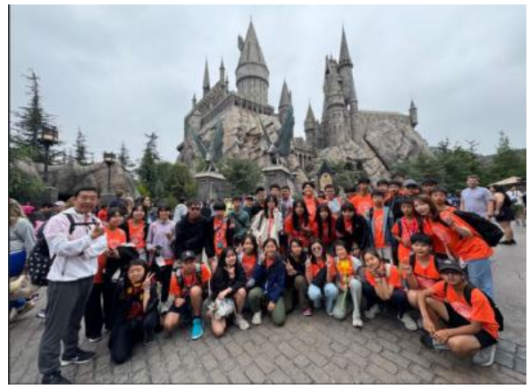
圖62(114/7/21)：學生於加州環球影城學習電影製作與商業運作模式