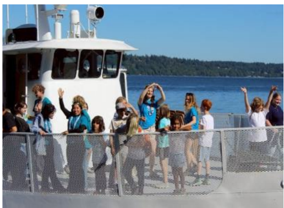
圖35(114/7/12)：學生於 Campfire 課程結束與外國學生歡送道別