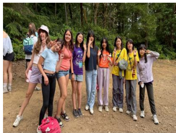
圖28(114/7/10)：學生於 Campfire 與外國學生一起進行森林生態課程