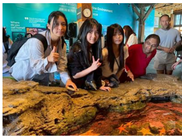
圖16(114/7/6)：學生於西雅圖水族館進行生態學習