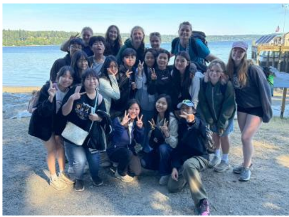
圖31(114/7/12)：學生於 Campfire 課程結束與外國學生歡送話別合照