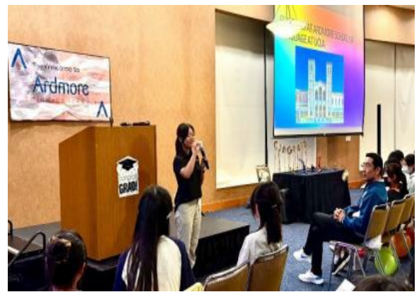
圖52(114/7/19)：學生於 UCLA 語言課程結束，代表上台以英語發表心得與感謝