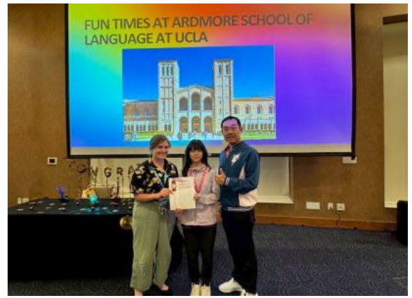
圖50(114/7/19)：學生於 UCLA 語言課程結束，辦理結業式並頒發結業證書