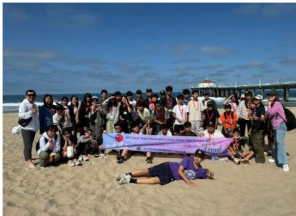
圖45(114/7/17)：學生前往曼哈頓海灘進行海洋生態課程與淨灘活動