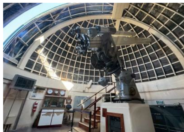
圖58(114/7/20)：學生於葛利菲斯天文台進行天文科學學習