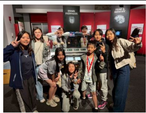
圖56(114/7/20)：學生於加州科學教育中心進行科學與科技學習