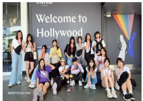
圖42(114/7/15)：學生前往 Hollywood 進行美國電影與藝術文化體驗