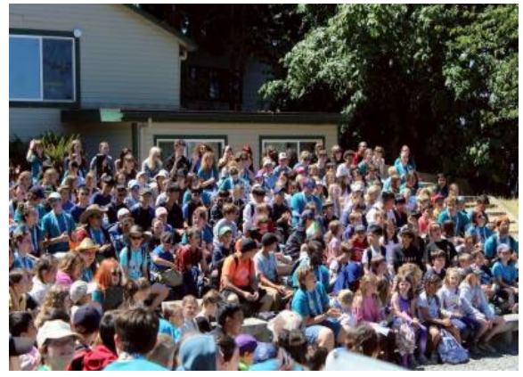
圖20(114/7/7)：學生抵達瓦雄島營地報到