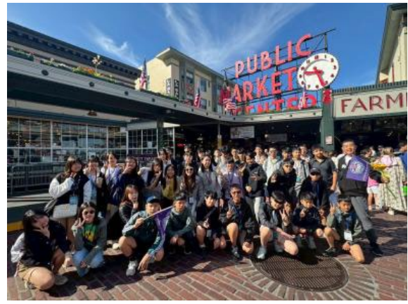
圖14(114/7/6)：學生參訪西雅圖派克市場