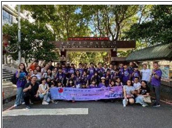
圖1(114/7/4)：學生出發前於林口國中集合