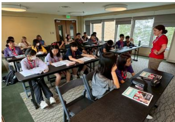
圖47(114/7/18)：學生於 UCLA 與外國學生一起進行語言課程