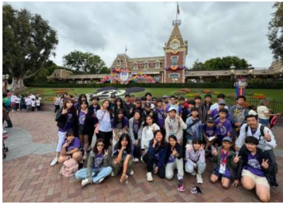
圖63(114/7/22)：學生於加州迪士尼學習成功商業運作模式