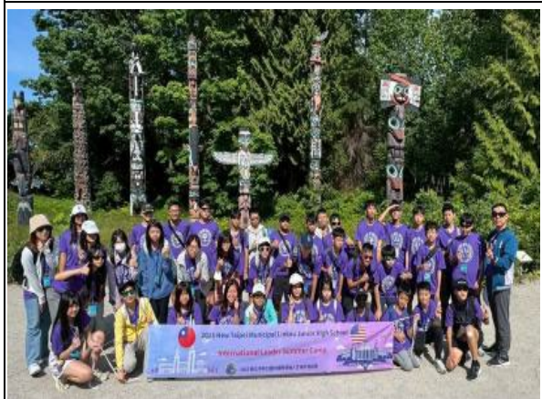
圖3(114/7/4)：學生於溫哥華史丹利公園參訪圖騰柱