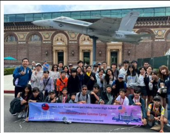
圖55(114/7/20)：學生於加州科學教育中心進行科學與科技學習