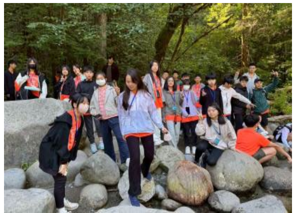
圖10(114/7/5)：學生於林恩峽谷進行地形學習