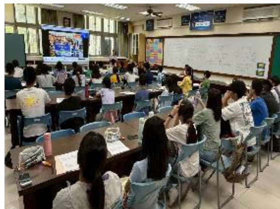
圖2 行前行銷臺灣文化培訓課程