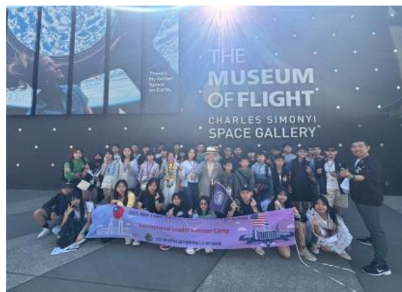
圖17(114/7/6)：學生於波音航空博物館學習航太科技