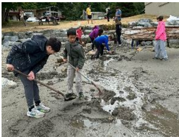
圖27(114/7/10)：學生於 Campfire 與外國學生進行水利課程