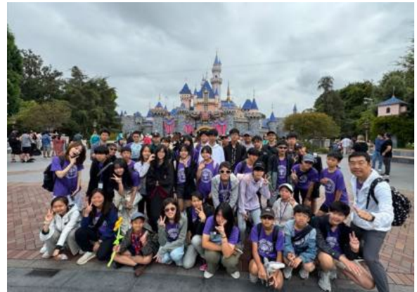
圖64(114/7/20)：學生於加州迪士尼學習成功商業運作模式