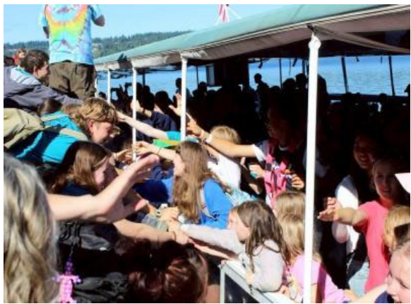
圖33(114/7/12)：學生於 Campfire 課程結束與外國學生歡送話別