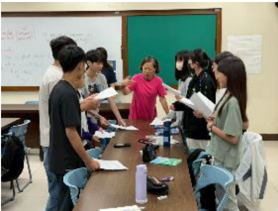
圖1 行前美國文化培訓課程

為了讓同學在參訪過程中能有更多收穫，特別在出發前安排了18個小時的美國文化與生活美語的課程(圖1)以及行銷臺灣特色文化課程(圖2)。此一課程不僅美國禮儀及簡介各景點，同時也教導簡單生活美語，以方便同學交流所需；也讓學生深入瞭解臺灣值得行銷的文化特色、制度與美食。