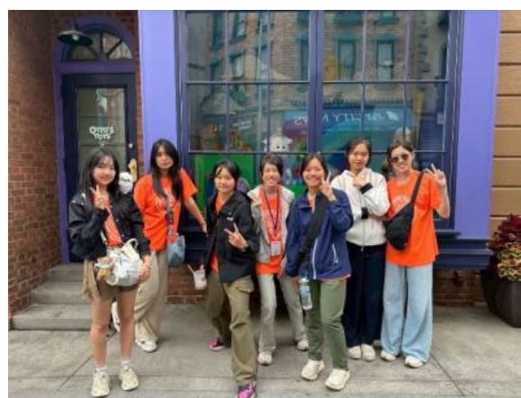
圖59(114/7/21)：學生於加州環球影城學習電影製作與商業運作模式