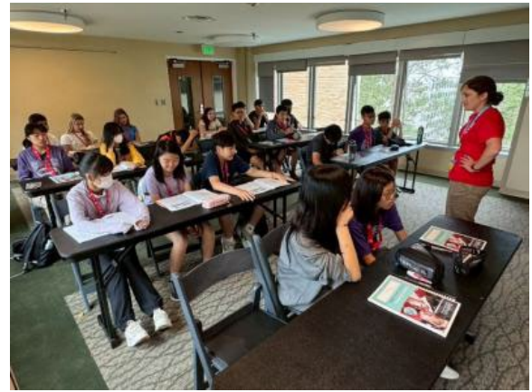
圖44(114/7/16)：學生於 UCLA 與外國學生一起進行語言課程