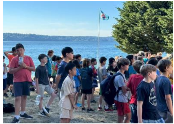
圖22(114/7/7)說明：學生於 Campfire 與外國學生共學