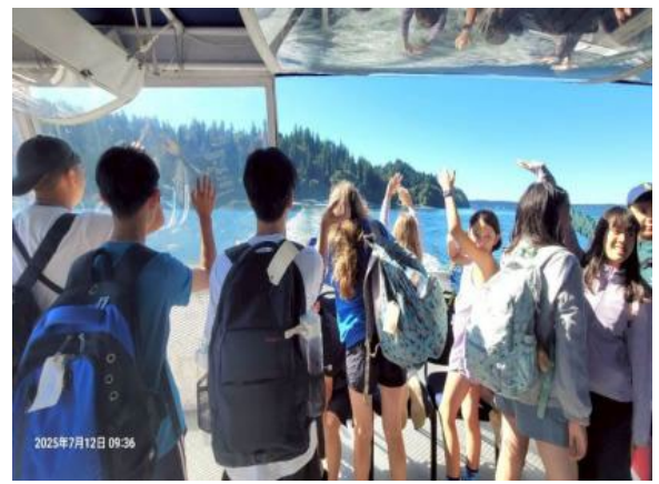
圖32(114/7/12)：學生於 Campfire 課程結束與外國學生歡送話別