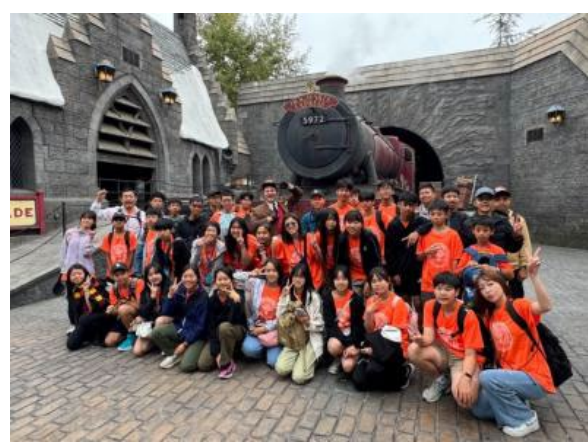
圖60(114/7/21)：學生於加州環球影城學習電影製作與商業運作模式