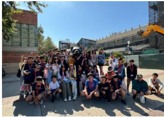
圖37(114/7/13)：學生於 UCLA 吉祥物-Going Bear 前合照