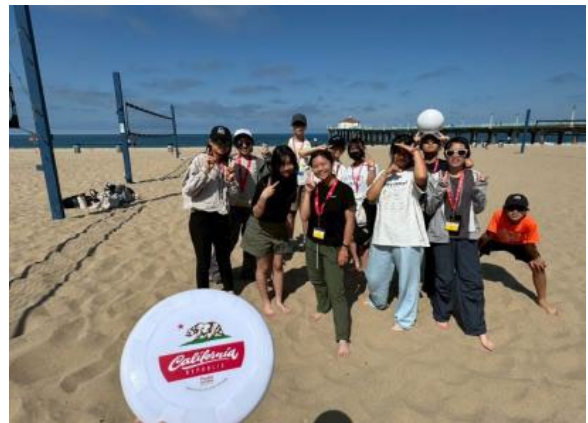
圖46(114/7/17)：學生前往曼哈頓海灘體驗沙灘排球