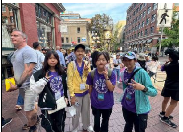
圖5(114/7/4)：學生於加拿大 GASTOWN 參訪蒸汽鐘