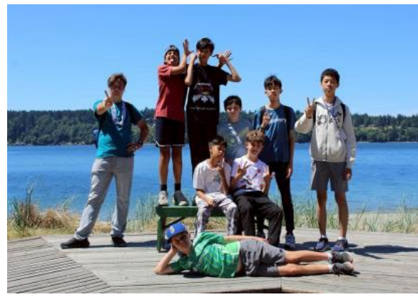
圖21(114/7/7)說明：學生於 Campfire 與外國學生互動