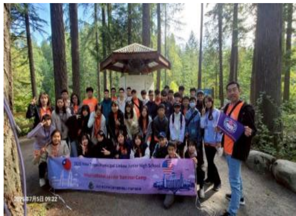
圖9(114/7/5)：學生於林恩峽谷進行地形學習