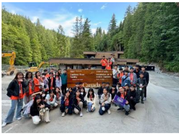
圖7(114/7/5)：學生前往鮭魚孵化場參訪鮭魚生態