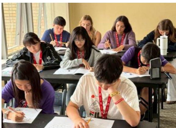
圖41(114/7/15)：學生於 UCLA 與外國學生一起進行語言課程