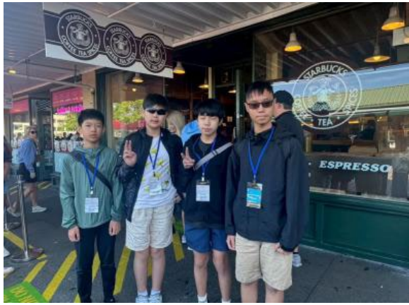
圖13(114/7/6)：學生參訪西雅圖星巴克創始店