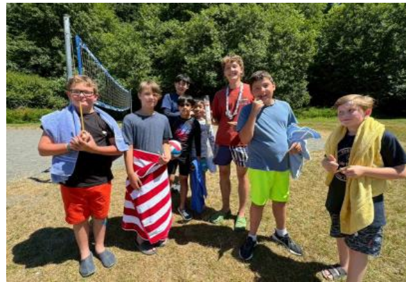
圖23(114/7/8)：學生於 Campfire 與外國學生分享臺灣點心