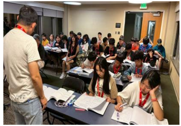
圖38(114/7/13)：學生於 UCLA 大學教室進行夜間國際領袖人才學習手冊探討