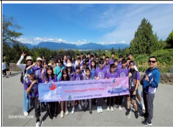
圖4(114年/7/4)：學生於溫哥華伊莉莎白公園生態參訪