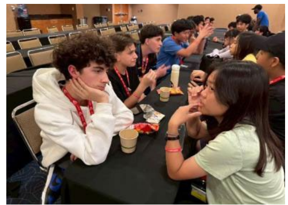
圖40(114/7/14)：學生於 UCLA 大學與外國學生進行破冰課程，增加彼此間的認識