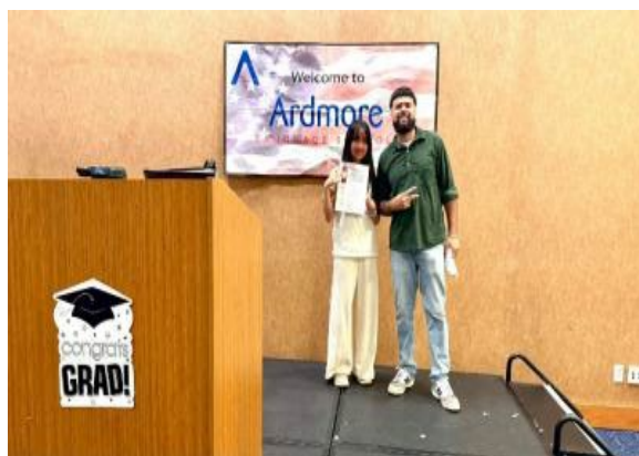
圖53(114/7/19)：學生於 UCLA 語言課程結束，與授課教師合影留念