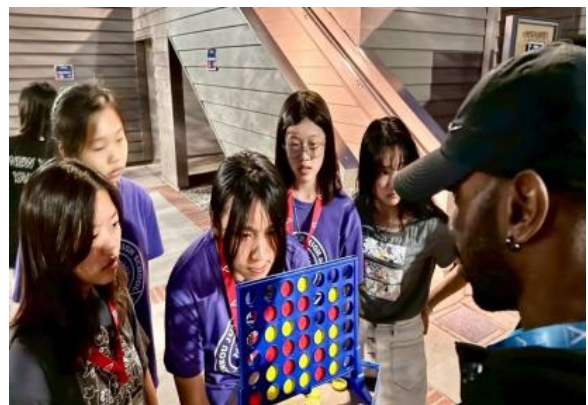
圖48(114/7/18)：學生於 UCLA 進行桌遊活動