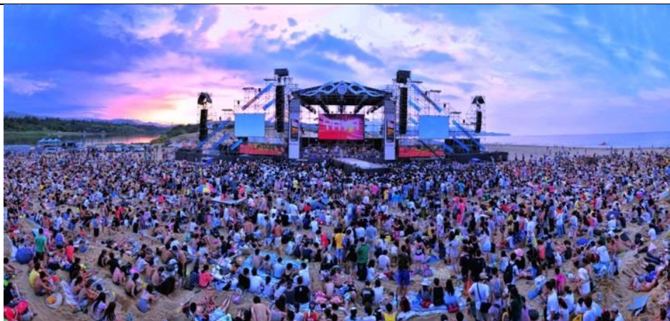
2012 海祭 (舞台沙灘)