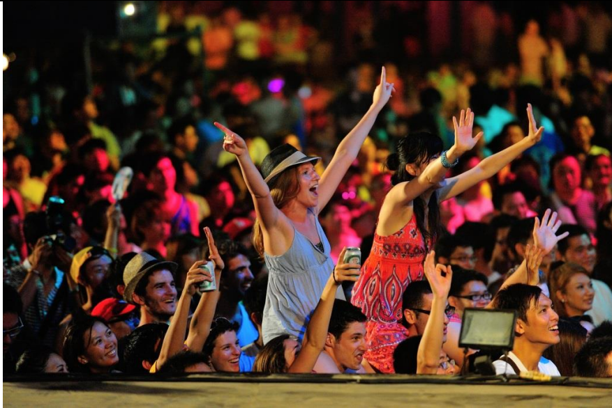
2012 海祭 (觀眾)