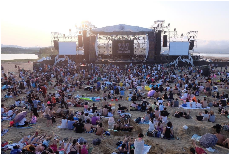
2016 海祭 (舞台沙灘)