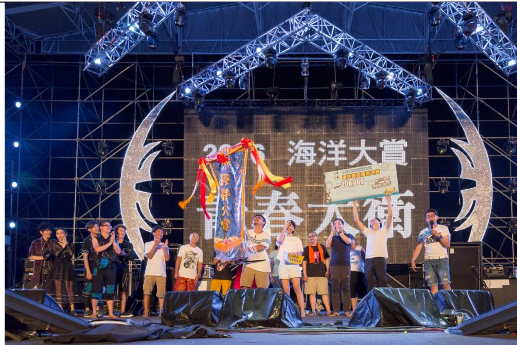
2016 海祭 海洋大賞 (青春大衛)