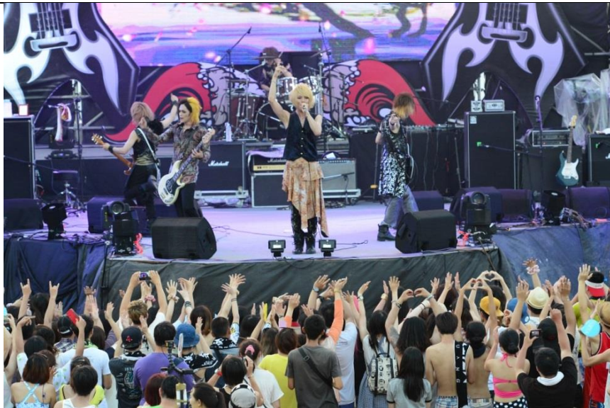
2014 海祭舞台表演 (日本 D=OUT 樂團)