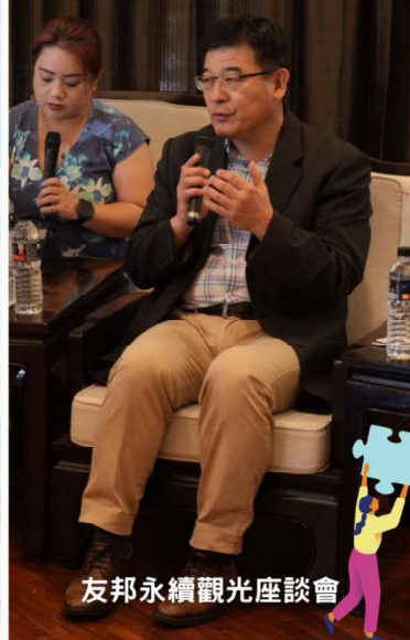
友邦永續觀光座談會