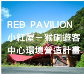
2023 Landezine國際景觀獎 2023第十屆台灣景觀大獎 2023國家卓越建設