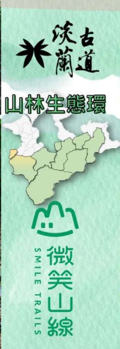
淡蘭古道 山林生態環