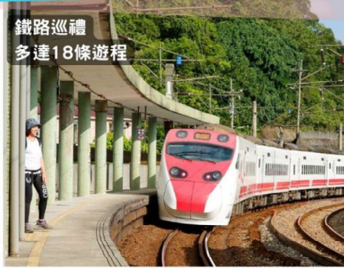
鐵路巡禮 多達 18 條遊程