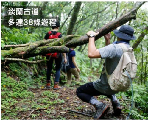
淡蘭古道 多達 38 條遊程