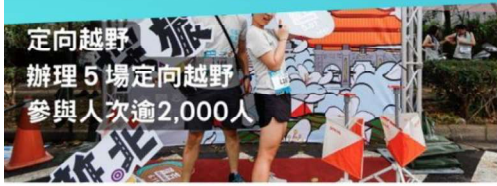
定向越野 辦理 5 場定向越野 參與人次逾 2,000 人