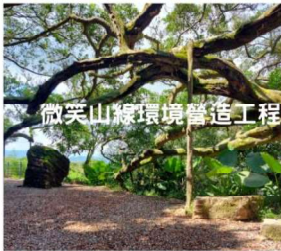
榮獲2022年臺灣景觀大獎