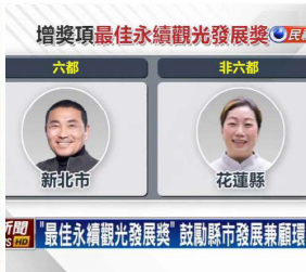
《今周刊》二〇二三年永續城市SDGs大調查，榮獲的「最佳永續觀光發展獎」