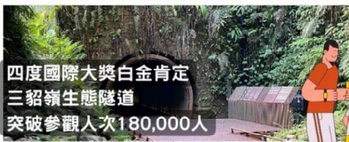
四度國際大獎白金肯定 三貂嶺生態隧道 突破參觀人次 180,000 人