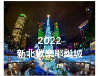
2023第十屆台灣活動卓越獎-公共服務活動 銀質獎