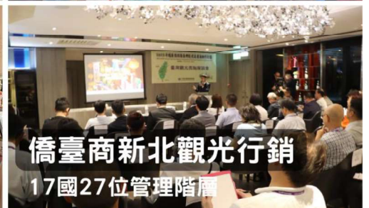
僑臺商新北觀光行銷