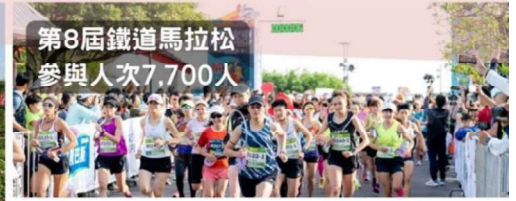
第 8 屆鐵道馬拉松 參與人次 7,700 人