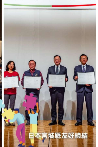
日本宮城縣友好締結