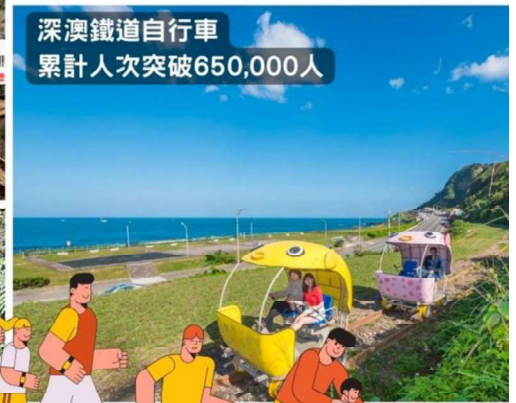
深澳鐵道自行車 累計人次突破 650,000 人

市民可以透過單車、路跑、鐵路，沿著路線探索這座城市，或者拋開方向感，來場定向越野享受未知。