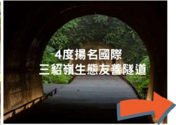
「2023法國建築師境外設計大獎」、「2023世界景觀設計獎」、「2023國際景觀獎」及「2023魁北克設計大獎」