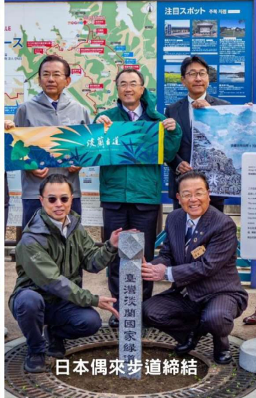
日本偶來步道締結