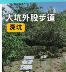
大坑外股步道 深坑