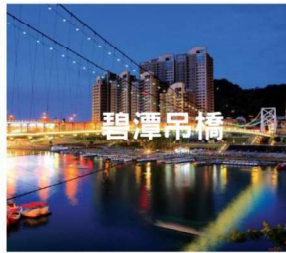
2023國家卓越獎-特別獎 最佳管理維護類、23屆公共工程金質獎