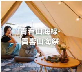
2023第十屆台灣活動卓越獎-公共服務活動 佳作