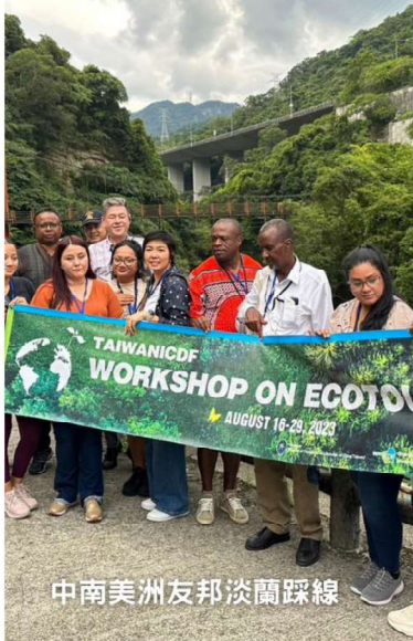
中南美洲友邦淡蘭踩線