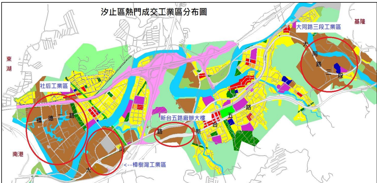
圖 3: 汐止區熱門成交工業區分布圖