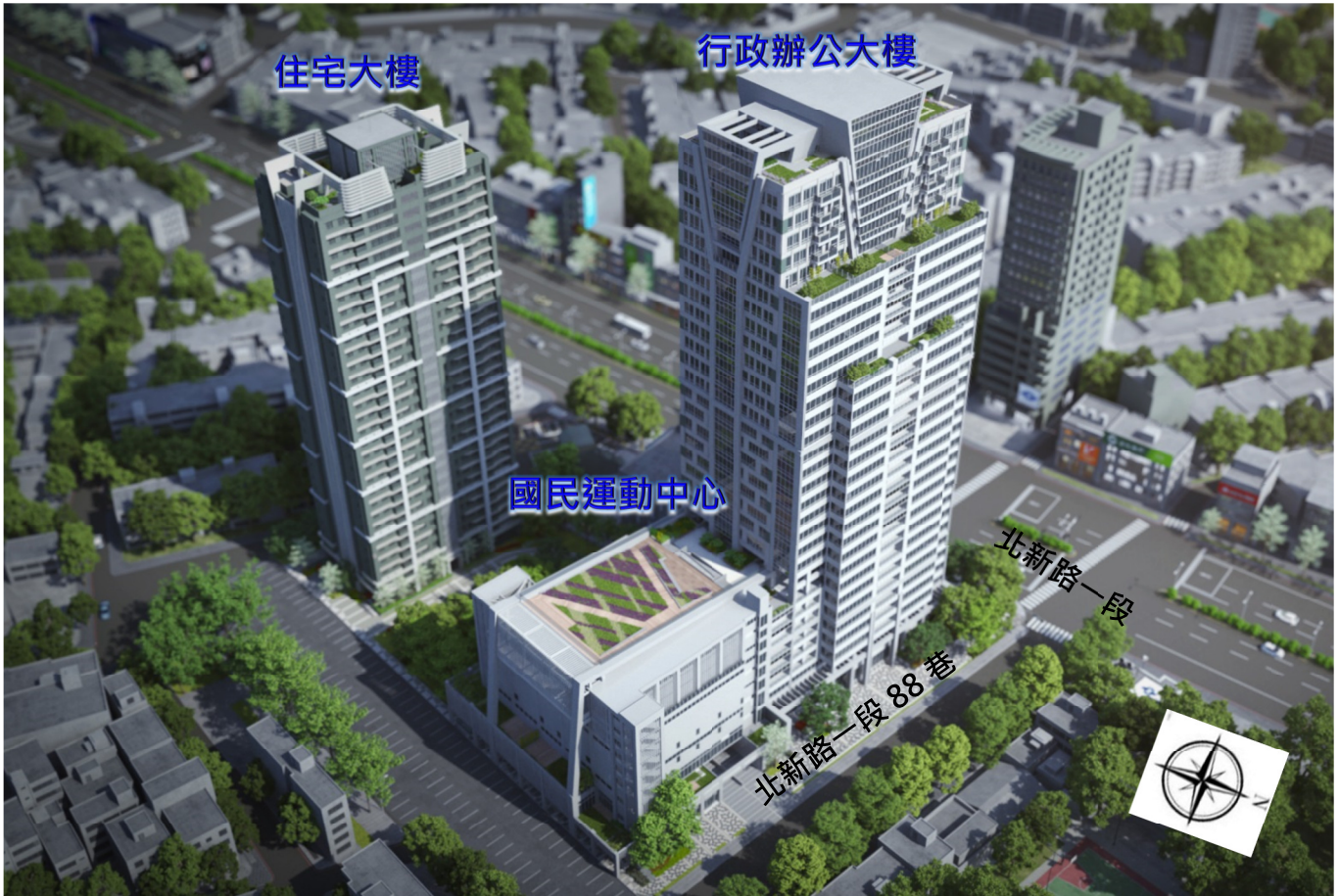
新店行政生活園區模擬示意圖