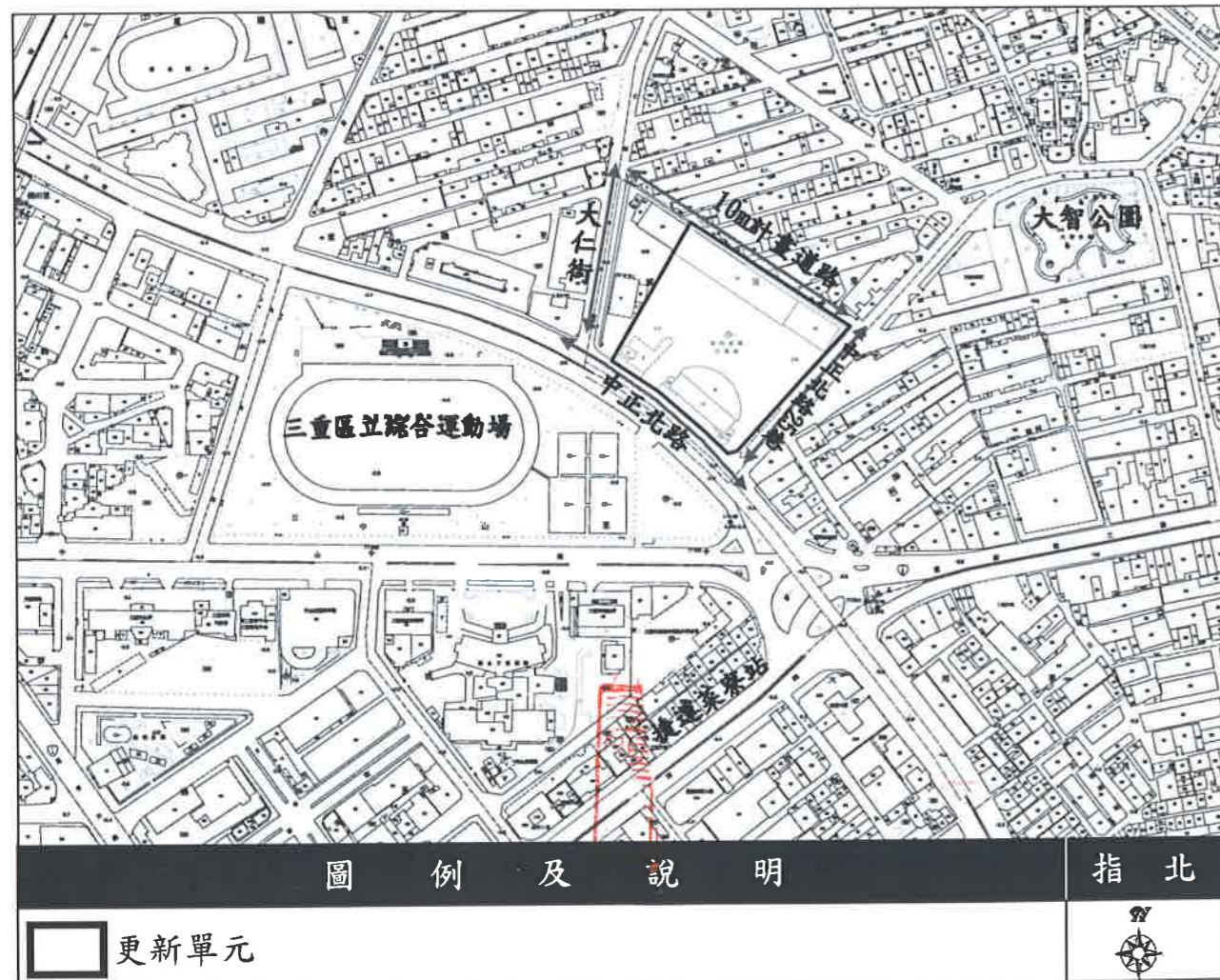
圖 2-1 更新單元位置示意圖

本更新單元基地位於新北市三重區大仁街、中正北路、中正北路 25 巷及 10m 計畫道路所圍街廓內（詳圖 2-1 更新單元位置示意圖）。本更新單元係屬未經劃定應實施更新之地區。