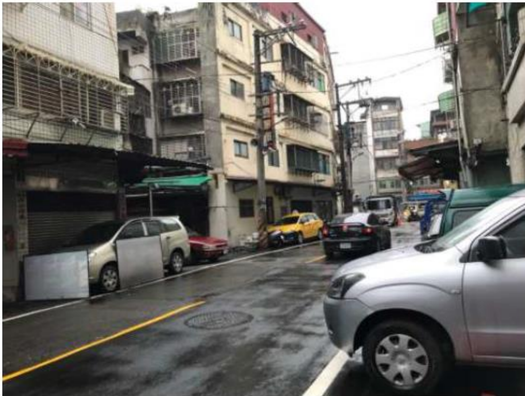
勘估標的臨路現況（員山路 294 巷）