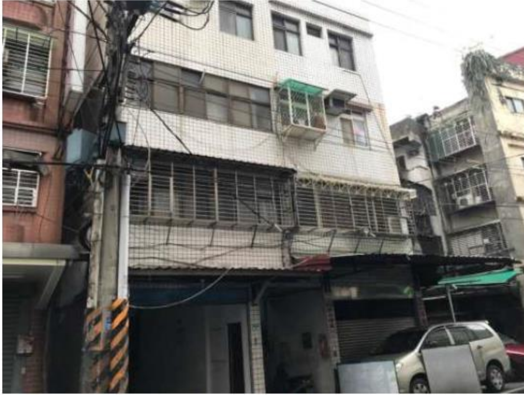
勘估標的建物外觀